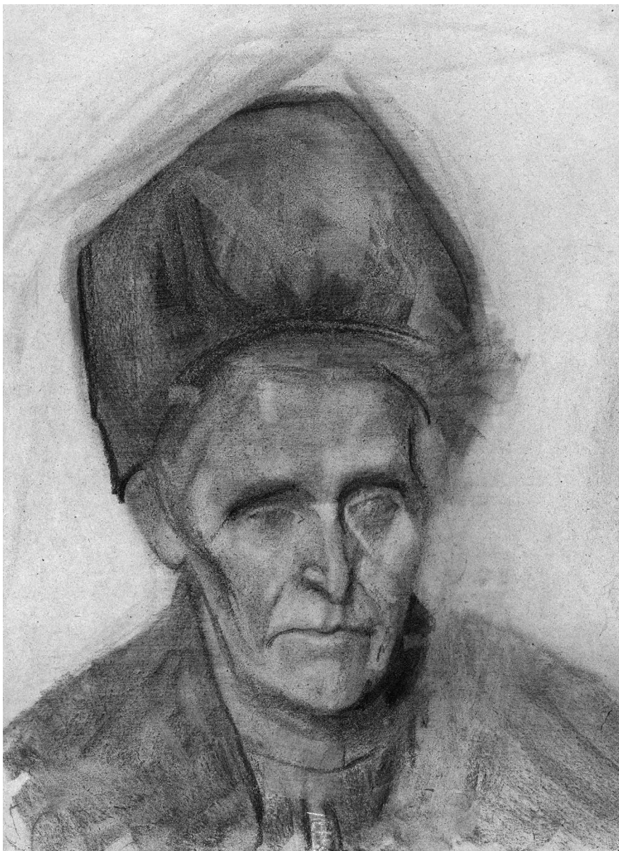
Farkas István: Idős nő arcképe, 1906–1910 k. Papír, ceruza, 460 x 320 mm, magántulajdon.