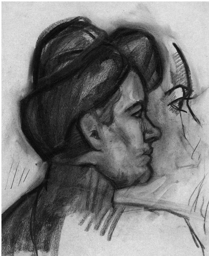
Farkas István: Nő profilban, 1906–1910 k. Papír, ceruza, 460 x 320 mm, magántulajdon.

közben a temperálást, a kozmetikai lehetőségeket keresni. Csakugyan: elszánt és komor erővel szegi a vászonra a Káin-bélyegeket is. Minden egyéb mellékessé, járulékosává válik a szemében, felesleggé, ami csak tompítaná a megtalált kifejező vonás életét. Innen a részletekben való fukarság legtöbb képén. Hogy ennek nem az elmélyedés hiánya az oka, azt régibb képeinek előadásán látjuk, modellképeken és arcképeken, amelyeken még az ábrázolat minden irányban való kinyomozása látszott fontosnak. Ilyfajta képei is elárulják a teljes készséget, csak a végső konzekvencia