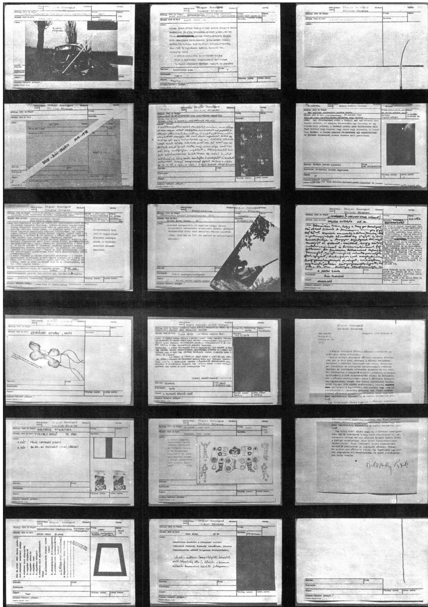
1. A Magyar Avantgard Művészet Múzeumának katalógus lapja.

cikkből 14 vág ki fásasztó leírásokat. Ezzel nem csak a tervgazdálkodást, hanem a műkritikát és végső soron saját művészetének recepcióját is az ironia területére utalja.