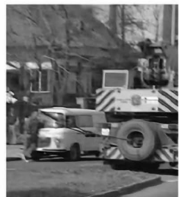
1. Kiss István debreceni Tanácsköztársaság-emlékművének ledöntése, 1990. március 20. Little Warsaw: Rebels . Budapest: tranzit.hu-Kassák Lajos Alapítvány, 2017. 30. A művészek jóvoltából © Kis Varsó © HUNGART 2020