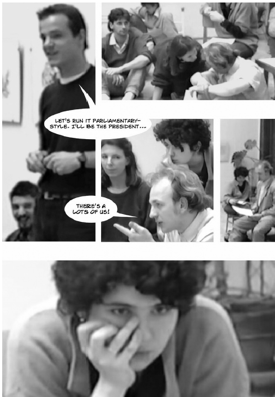
4. A Magyar Képzőművészeti Főiskola első nagy diákfóruma, 1990. március 1. Little Warsaw: Rebels . Budapest: tranzit.hu-Kassák Lajos Alapítvány, 2017. 64. A művészek jóvoltából © Kis Varsó © HUNGART 2020