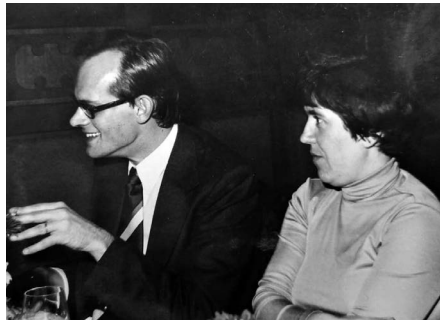
Marosi Ernő portréja, 70-es évek