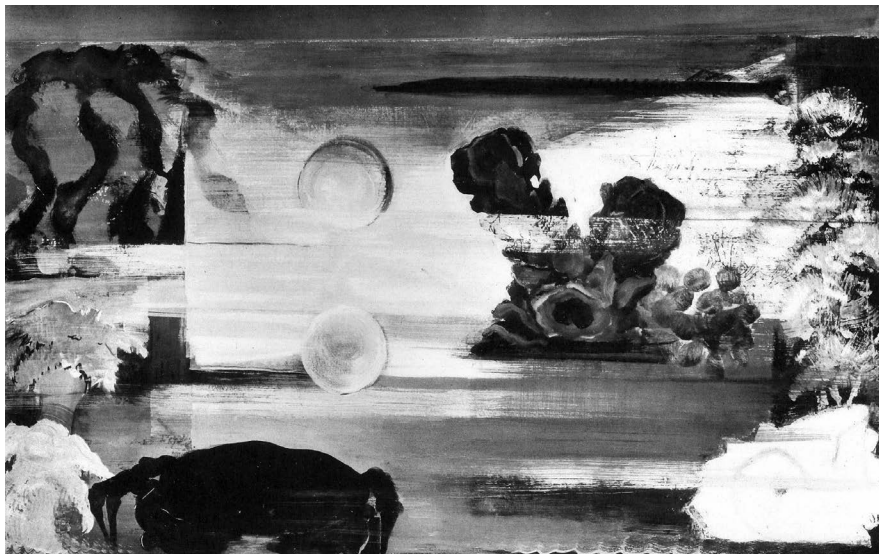
Farkas István: Világok (Vizek mélyén, tenger), 1928. Tempera, fa, 66 x 127 cm. KKJM, ltsz.: 84.87. Repr. André Salmon: Etienne Farkas . Paris, 1935. 6.