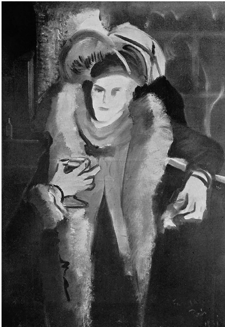
Farkas István: Rondele (A Rondele-kávéházban), 1931. tempera, fa. Lappang. Repr. Kihűlt világ . 2019 (kat.) 298.