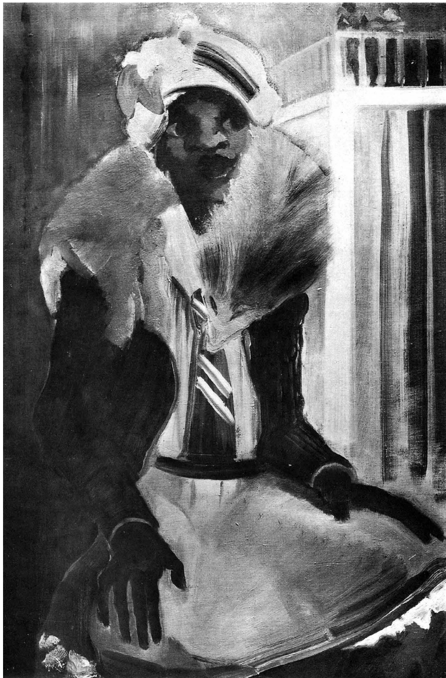
Farkas István: Néger nő, 1932 (1931), tempera, fa, 81 x 54 cm. Lappang. Repr. Kihűlt világ 2019 (kat.) 298. Repr. André Salmon: Etienne Farkas . Paris, 1935. 12.