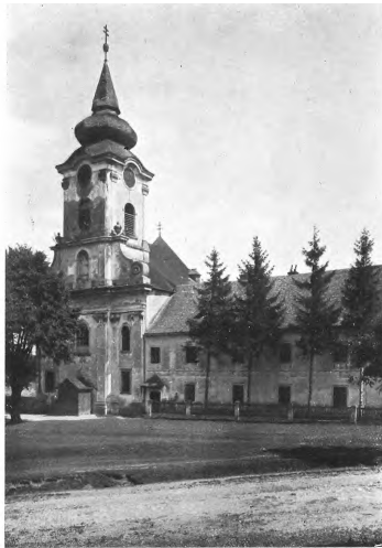
Abb. 325. Stotzing, Servitenkirche und Kloster (S. 299).