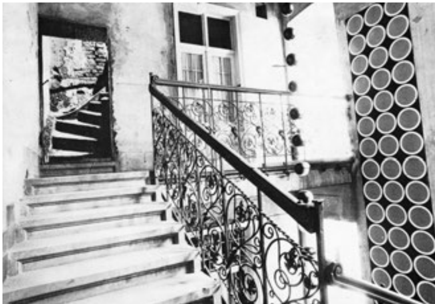
3. Csutoros Sándor, Haris László, Molnár V. József: Lépcsőház-akció. Budapest, 1973. Mezei Ottó hagyatéka. ELKH BTK MI Adattár MI-C-I-214.