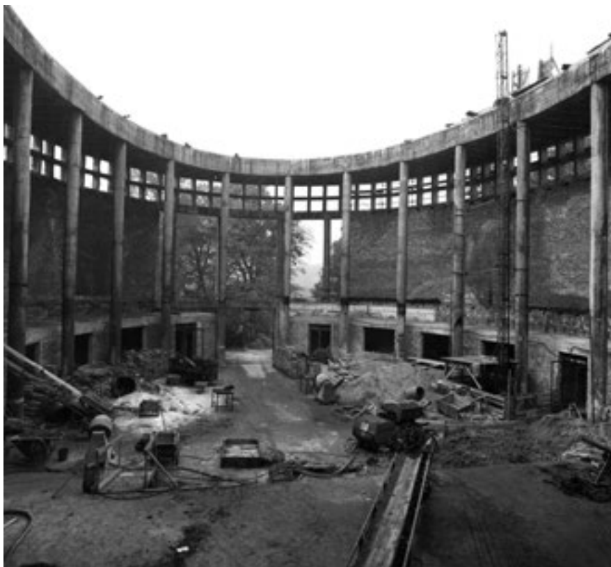
2. Molnár Farkas: Magyar Szentföld-templom, Budapest, 1938–1949.

Mezei Ottó hagyatéka. (A Fővárosi Levéltár dokumentációs anyagából, 1975 e.)