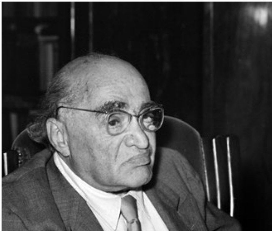
3. Füst Milán lakásában, 1963-ban.

„Tévedés azt hinni, hogy vannak olyan kincseink, amelyek akkor a legjelentősebbek számunkra, ha nem kell róluk tudomást vennünk. Az egészségről szokás azt mondani, hogy akkor igazán javunk, ha nem érezzük. A ritmus természetességének is az a legfőbb bizonyosága némelyek szerint, hogy észre sem vesszük. – – Ez az észrevétel kissé schopenhaueri természetű. Minden olyan javunkról ezt állíthatnók, amelynek élvezetét vágy, vagy szenvedés nem előzi meg.” 21 Másutt: „S amellet, hogy az életet, s a jó életet kedveli: van egy fájdalmas vonás mosolyában, amely Schopenhauerra emlékeztet.... Oly fájdalmas ez a mosoly! s mintha azt akarná véle mondani, hogy a vágyakat le kell igázni, ki kell irtani...” 22 Mednyánszky egész életét a vágyak leigázásának, kiirtásának szentelte, erre predesztinálta a korban üldözött homoszexualitása, de a művészethez való viszonya is, aminek mindent alárendelt. A rohanó víz éppúgy, mint a tovairamló élet mulandósága felett elmélkedő ember, a romantikus festészet toposzaitól és a korban divatos, színezett keleti fametszetek, így Hokusai hatásától sem érintetlen, szimbolikus motívum Mednyánszkyknál, de a mozgó víz megfestése egészen másért is foglalkoztatta. Ritmusproblémát látott benne, technikai