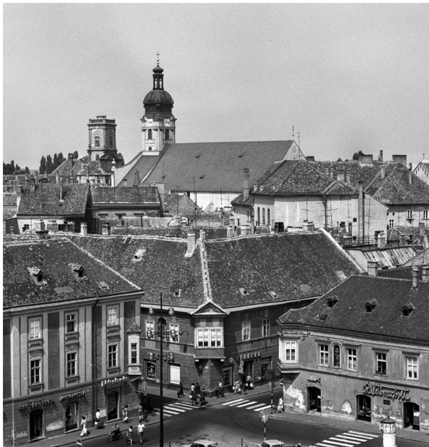
9. A győri belváros – műemléki jelentőségű terület, 1977