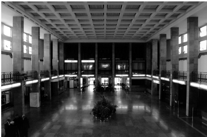
15. A Ferihegyi repülőtér 1. felvételi épülete, 2004 © MÉM MDK, Tervtár, ltsz. D 47925

pedig, ahogy említettem, egészen kiváló volt. Az ottani ácsok mesterszinten űzték a munkájukat, a kőművesek gyönyörűen vakoltak, tehát sok szempontból példát mutattak a külső kivitelezőknek. A rendszerváltás után azonban rögtön kiderült, hogy ez a tevékenység nem piacképes, tehát ha az állam nem tekinti feladatának a fenntartását, akkor az egész nem működik, mert a piac sokkal olcsóbban tudja megcsinálni mindezt, persze sokkal gyengébb minőségben is. Sajnos a hivatal azonnal feladta a kivitelezést. Ez szintén kellemetlen következménye volt a rendszerváltást követő átalakulásnak, mivel egy hatóságnak nem lehettek ilyen részlegei. Önállósodniuk kellett, úgy viszont a piacon nem tudták fenntartani magukat. Szétszéledt mindenki, aminek ma még inkább érezni az eredményét. Juan Cabello nemrég ötször bontatott vissza egy egyszerű törtkő falszakaszt Szabolcsban, hatodszorra viszont már nem kísérelte meg, mert kiderült a kőművesekről, hogy egyszerűen képtelenek megcsinálni.