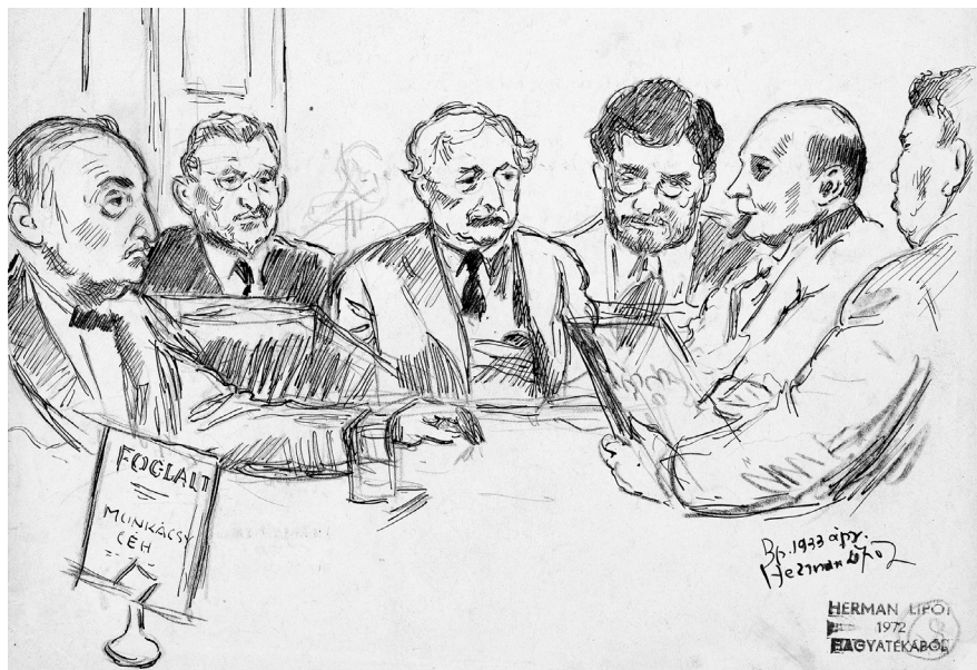
1. Herman Lipót: Munkácsy Céh, 1933. Ceruza, tus, toll, papír, 189×230 mm.

Felirat fent: Márk, Mannheimer, Iványi, Kernstok, Lázár, Herman. MNG Itsz. F.75.170.