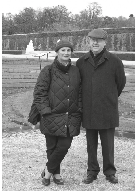
8. Trixivel a Belvedere épülő kertjében. © Ecsedy Anna felvétele, 2004

Utolsó kötete testamentum: nyílt, objektív számvetés és haragos – ugyanakkor reménykedő – figyelmeztetés, de egyúttal útravaló is. Fő mondandója, hogy a kulturális javaink legsérülékenyebb, legveszendőbb értékei közé tartozó történeti kerteket egy fel lendülő korszak és oly sokak eredményes erőfeszítései, együttműködése után magukra hagyták, hivatali pártfogásuk, szakmai kontrolljuk megszűnt, s hogy ez nem maradhat így egy, a kultúrájára oly büszke országban. Mint Hajós Géza egész életművét, úgy e problémát és De Profundis is – fájdalmasan – magunkénak érezhetjük.