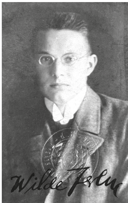
Wilde Ferenc útleveleképe, 1910 után.