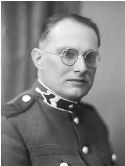
Wilde Ferenc 1918 körül