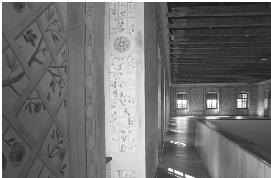
11. Részlet a belvedere restaurált falfestéséről, 2023.

A hercegi lakosztály előszobájának északi és nyugati falán 2017-ben feltárt kék-fehér chinoiserie szekko restaurálása eltért a korábbiaktól. A kép eredetileg törtfehér alapfelülete ugyanis olyan mértékben elszennyeződött, hogy a koszréteget nem lehetett eltávolítani, hanem csak enyhíteni lehetett rajta. A tisztítás ezért nem tárta fel az eredeti színezést. A 18. században az alakok megrajzolásához kétféle kék színt használtak, amiből a világosabb elpusztult, kipergett, helyét csak a koszréteg körvonala őrizte meg. A sötétebb kék szín is nagyon megkopott. A falfestés ennek következményeként mintegy negatív képként maradt fenn. A restaurálás célja a lehetőségekből kiindulva az volt, hogy a hiányok okozta zűrzavart megszüntessék és létrehozzanak egy értelmezhető, egységes felületet. A háttér egységesítését temperával és akvarellal végezték el, a figurákat viszont – minimálisan – pasztellel egészítették ki, ami biztosította a reverzibilitást. A festés így kopottságában látható, ami a negatív formákkal együtt maradandó esztétikai élményt nyújt. 53