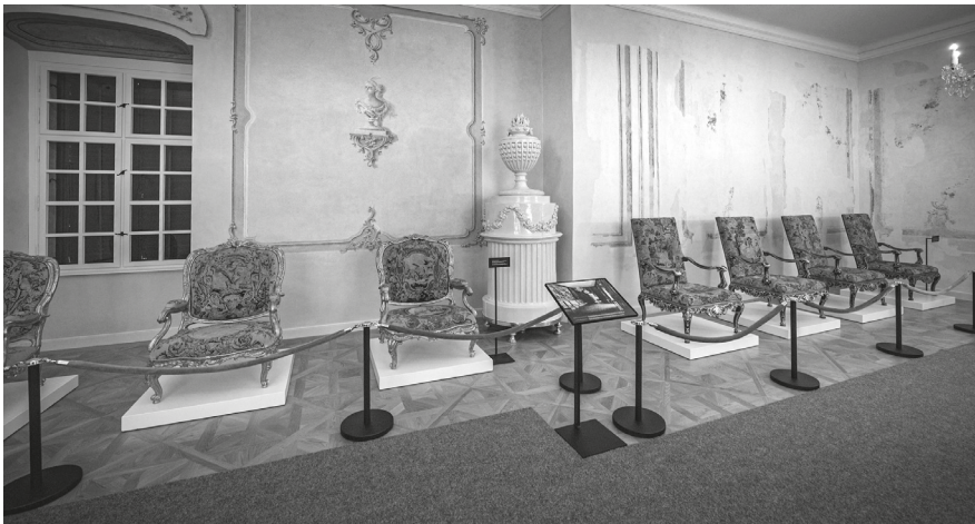
10. Három falfestés-periódus bemutatása az Albert szász-tescheni hercegi lakosztály északi traktusának előterében, 2023.

Fel szeretném hívni rá a figyelmet, hogy a kiállítási szövegek minden alkalommal tájékoztatják a látogatókat, ha rekonstrukciót, vagy 20. századi elemet látnak.