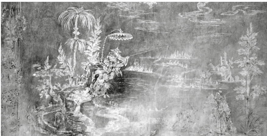
8. Részlet a hercegi előszoba északi falának negatívban fennmaradt chinoiserie falfestéséről, 2023.

és mixtion aranyozás került, az ajtók hibásan, mindkét szárnyra felszerelt rúdzárjait pedig kijavították és a fém lakatosszerkezeteket is felújították. 40