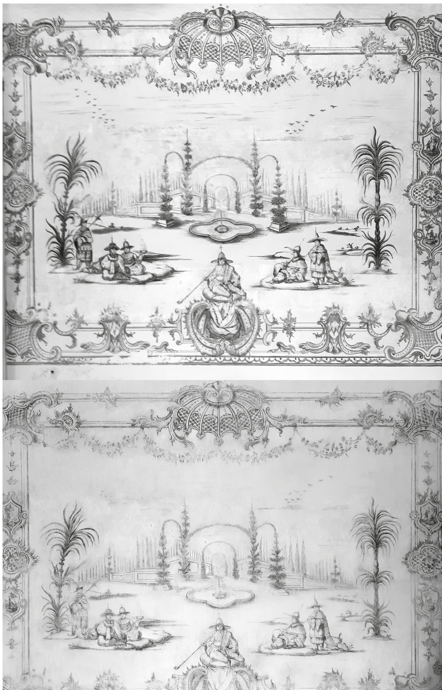
6. A hercegi sarokszalon északi falát borító chinoiserie falfestés restaurálás előtt (fent) és után (lent), 2021–2022.