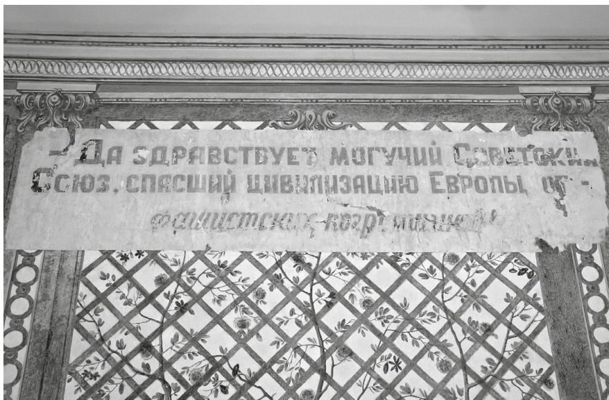
12. Orosz felirat 1944-45-ből a belvedere falán, 2023.

Az Albert szász-tescheni hercegi lakosztály északi traktusának előterében három 18. századi falfestés-réteg került elő. A legelső, rózsaszínes összhatású, női büsztöket ábrázoló réteg a középrész átellenes oldalán, a Mária Terézia-lakosztály porcelánaszobájában látható festéssel analóg. A második, zöldes színvilágú, virágfüzérekkel álló réteg a főlépcsőház falfestésével azonos. A legfelső réteg világos, zöldes alapszínű faltükrökkel és zöld babérlevélből komponált keretelésből áll. A helyiségben mindegyik réteg töredékes megőrzésére lehetőség nyílt. Mivel a szoba keleti részén a legelső rétegből maradt fenn nagyobb összefüggő felület, ott azt lehetett bemutatni, a két felső réteg pedig a nyugati részen látható. 55 Az előtérből nyíló kis szobában a legelső és a második réteg maradt fenn. Mivel itt a második réteg sokkal nagyobb területeken megvolt, mint az alsó, továbbá a szomszédos helyiségben az alsó réteg látható, az a döntés született, hogy a második réteget ki lehet retusálni, az alsó réteget pedig helyenként, kutatóablakokon keresztül lehet bemutatni. 56