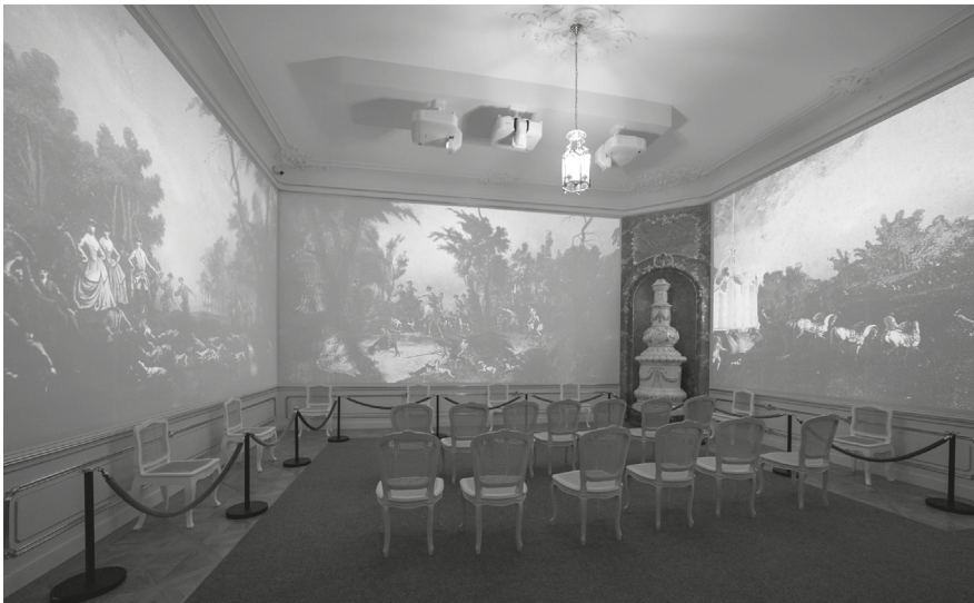
3. A Mária Terézia lakosztály előszobája: rekonstruált boiserie és az elpusztult, falkavadászatot ábrázoló pannókat felidéző vetítés, 2023.

feltárták a díszítőfestést. 19 A szilikátrestaurátori kutatások a homlokzati nyílászárófülkék stukkói, a kályhafülkék, valamint a párkányok eredeti részleteinek és kiegészítéseinek a viszonyát tisztázták. 20 A kályhákat már korábban felmérték és eredeti helyüket lokalizálták, ezt a felmérést most aktualizálták. 21 A 2017-ben végzett farestaurátori kutatásokat 2021-ben, a felújítások elkezdése előtt még kiegészítették, hogy pontosan elkülönítsék a nyílászárók és a boiserie-k 18. századi, illetve 20. századi részleteit. 22