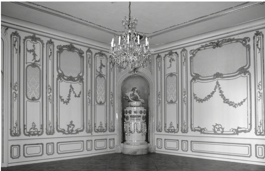
4. A restaurált hercegi háló, 2022.