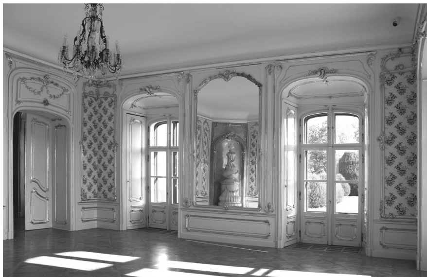
2. A rekonstruált hercegnéi sarokszalon, 2022.

és az elkorhadt csapos gerendafödémeket vasbeton szerkezetekre cserélték ki. A faszervezetek mintegy nyolcvan százalékos felújításra szorultak. Ott, ahol meg lehetett őrizni a korábbi nyílászárók és fa falburkolatok, boiserie-k maradványait, újonnan faragott, de részleteikben az eredetitől némileg eltérő szerkezetekbe építették be őket. A színeket tompították, a megmaradt aranyozást tisztították, de új aranyozás helyett az aranyozandó felületeket csak okker színű krétával vonták be. A többi helyiséget egyszerűen bevakolták. 11 A nyílászárókra bronzöntvényeket, illetve bronzszínű fémszerkezeteket szereltek fel sokkal díszesebb és részletgazdagabb formákkal, mint amilyenek az eredeti fémszerkezetek voltak. Ráadásul a kétszárnyú ajtók rúdzárjait hibásan alakították ki: mindkét ajtószárnyra felszerelték őket. 12 A földszinten a hercegi lakosztály előszobáját, valamint a hercegnéi lakosztály sarokszalonját és hálósobáját, továbbá az emeleten a Mária Terézia-lakosztály előszobáját boiserie-be foglalt textiltapétával burkolták. 13 Ezeknek a