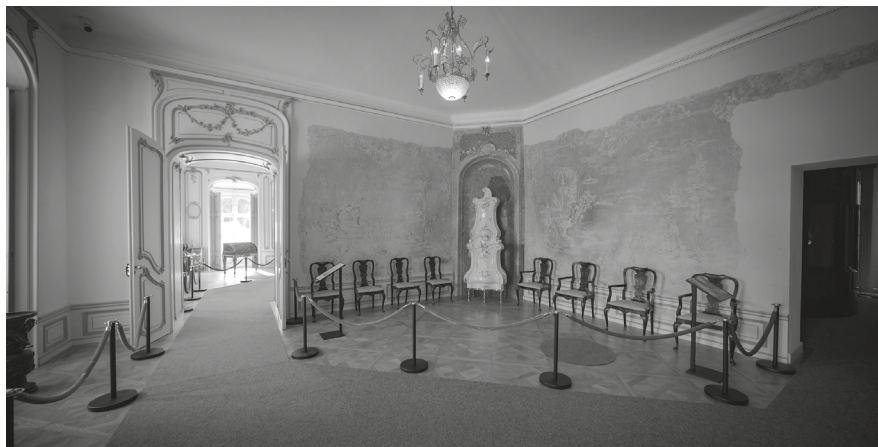
7. A hercegi előszoba 2017-ben feltárt chinoiserie falképeinek bemutatása, 2023.