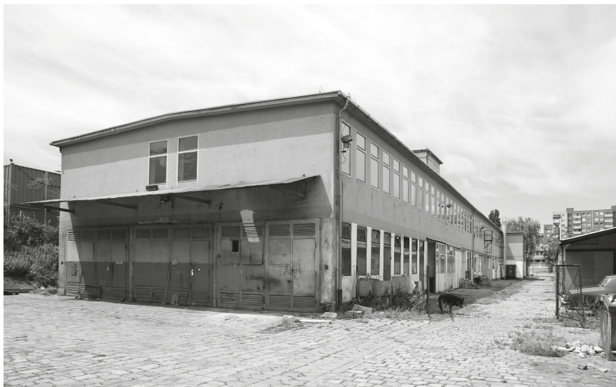
2. A Központi Műhely egykori Talpas utcai telephelye 2012-ben.