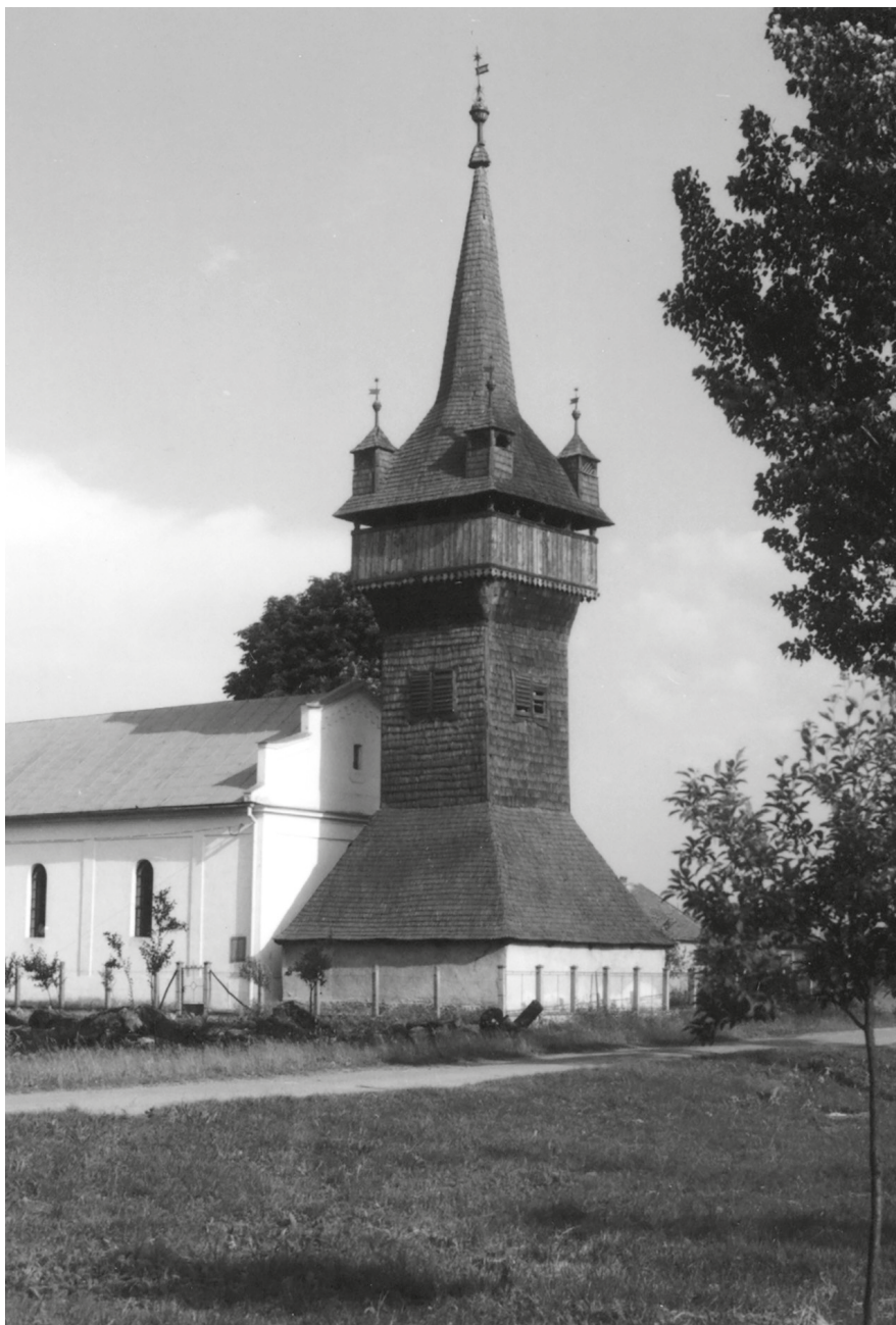
9. Zsurk, református harangláb © Dobos Lajos felvétele, 1990. – MÉM MDK, Fotótár, ltsz. 155.841N