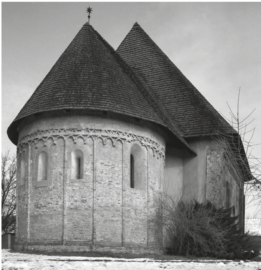
3. Karcsa, református templom, 2000. © Galacanu Efstatia felvétele – MÉM MDK, Fotótár, Itsz. 189.460N

Ilyenek voltak a napi problémák, ilyen munkákat kellett akár a művezetőnek, akár az asztalosoknak elvégezni. Abban az időben az anyagbeszerzés sem ment könnyen. Az 1970-es években az egész országban nagyon nehéz volt faanyaghoz jutni, azt kizárólag a kijelölt ERDÉRT-en 8 keresztül lehetett beszerezni. Az OMF úgy kapott segítséget, hogy egy kapcsolatom útján felkereshettem a vállalat vezérigazgatóját, és a meghallgatás után a hivatalt „kiemelt gyártóként” kezelték, ami könnyebben jutott faanyaghoz. Nagyon sok olyan gyártmányt kértek tőlünk, amit korábban nem alkalmaztak;