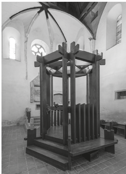
8. Sopron, zsinagóga © Hack Róbert felvétele, 2022. – MÉM MDK, Fotótár, ltsz. 244.906D

MI: A legyártott nyílászárók elhelyezése után a vasalatok felszerelését és a szerkezetek illesztését is a Központi Műhely asztalosai végezték el. Minden egyes építésvezetőség fölött egy asztalost, aki a kisebb helyi munkákat elvégezte, amire így nem kellett külön Budapestről leküldeni a szakembereket. A komplett, kész szerkezeteket (a pántolást vagy egy általunk készített vasajtót, vasrácsot) az építésvezetőség helyezte el.