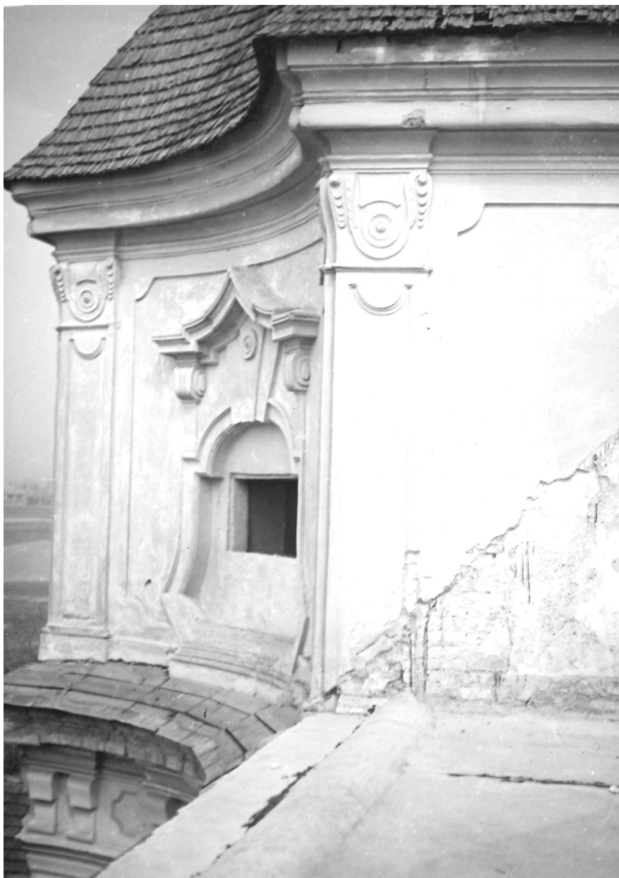
11. Ráckeve, a Savoyai-kastély lantablaka, 1961. © MÉM MDK, Tervtár, ltsz. D 5832