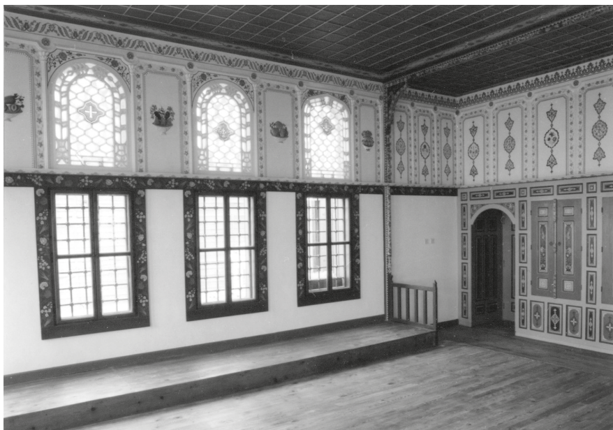
7. Rodostó, Rákóczi-ház, ebédlő.

ebédlőszekrényt, és ezt kiszállították Rodostóba. A rodostói építőipari munkákat – az ablakok elhelyezését, a tetőt és az összes építésmunkát – a Pécsi Építésvezetőség végezte. A helyszíni befejezési munkák lebonyolításával építésvezetőként engem bíztak meg, én adtam át az épületet. Elég komoly szakembergárda volt kint, egymást váltották az asztalosok, lakatosok, díszműlakatosok, díszműbádogosok, festőrestaurátorok. 40