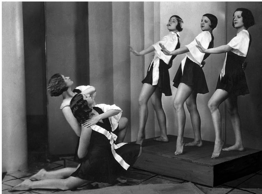
Kállay-csoport: Ritmusok , 1930-as évek.