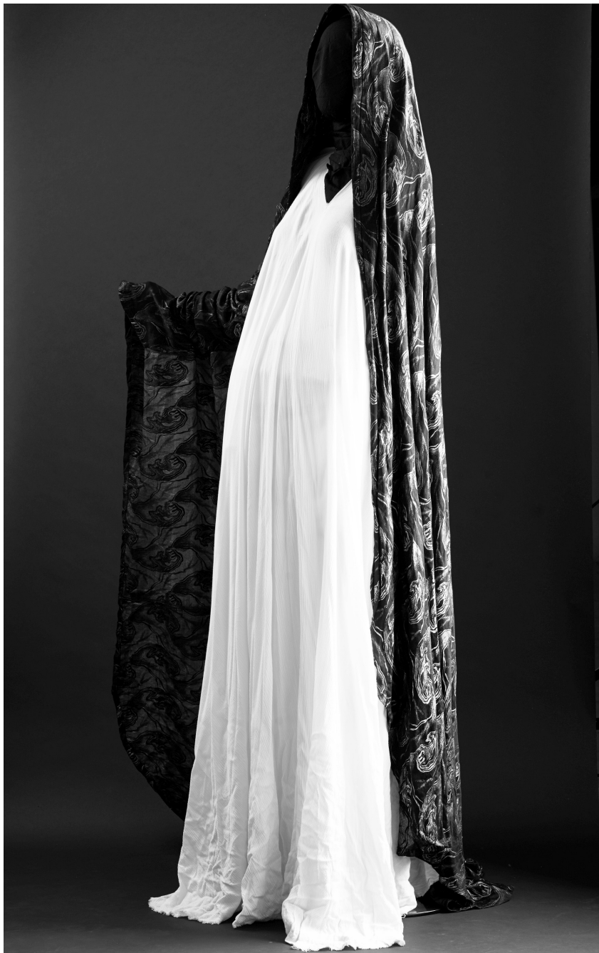
Márk Tivadar (?): A Pietà kosztümje, 1946.