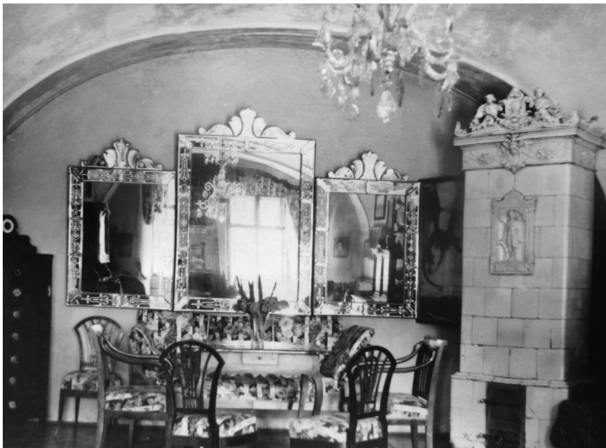
3. A nagyőri kastély egyik szobája velencei tükörrel. 1930. Fotográfia.

óhajtom, hogy az uraság jelenlétében nyitassanak a ládák, s a tükrök vigyázattal kezeltesenek.