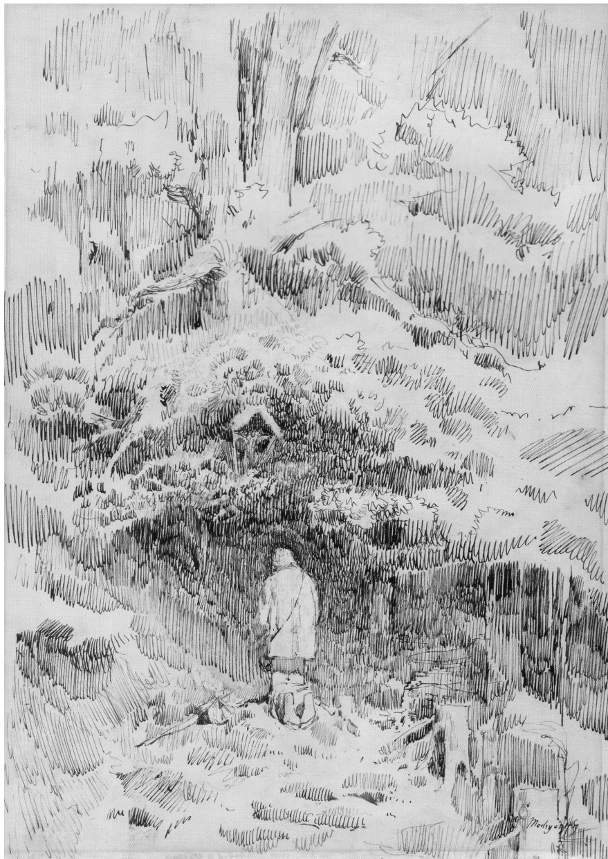
Mednyánszky László: Imádkozó II., 1884 k., tus, papír, 28,5 x 20,5 cm, j. j. I. Mednyánszky. Magántulajdon (Repr. SOGA kat 73.)