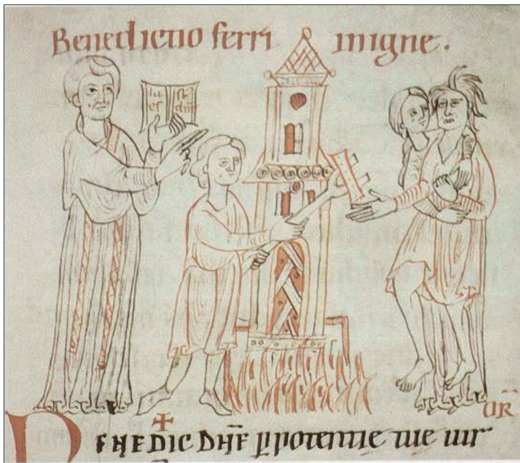
Tüzesvas-próba - korabeli metszet