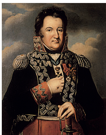
Jan Henryk Dabrowski