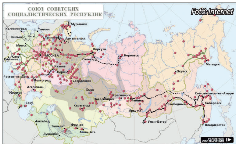
A Szovjetunió területén lévő Gulag táborok térképe 1945

A túsokat előbb Balmazújvárosban a Semsei-kastélyban, majd Debrecenben a Pavilon laktanyában tartották fogva, utána marhavagonokban Nagyváradra, decemberben pedig a moldáviai Benderibe, illetve Tulába és a szibériai Kolyamába szállították.