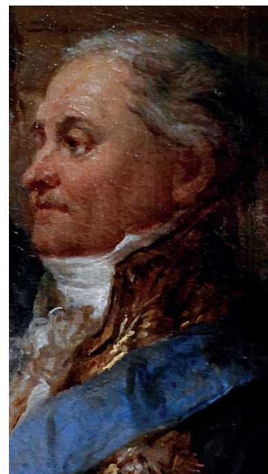
Mazurek Dąbrowskiego

A Lengyel Himnusz szövege és dallama a „Mazurek Dąbrowskiego” –ig vezethető vissza. 1797-ben Jan Henryk Dąbrowski lengyel tábornok itáliai lengyel légiójának tisztje Józef Wybicki író és politikus írt szöveget a dallamra, amely elterjedt Lengyelországban is. A lengyelek szabadságért és a lengyel hazáért folytatott csaták elmaradhatatlan lelkesítő zenéje lett, a felkelések, forradalmak indulója. Amikor a három részre szakított Lengyelország újra egyesült 1918-ban, először énekelhették szabadon himnuszként, ám hivatalosan csak 1926-ban vált nemzeti himnusszá.