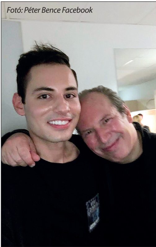
Hans Zimmer társaságában

Én is rabja lettem olyan filmművészeti ikonikus alkotásoknak, mint a Star Wars, vagy a Jurassic Park, vagy akár Harry Potter. A különleges bennük és talán a sikerükben is, hogy mindnek John Williams írta a zenéjét. Nem tagadom: akkoriban ezekkel a zenékkal keltem és feküdtem, és ez volt az, ami igazán arra inspirált, hogy filmzenét tanuljak a Berklee-n. Az meg egyenesen életem egyik legszebb pillanata volt, amikor John Williams boston-i koncertjén élőben vezényelte műveit és én ezt az első sorból hallgathattam. Az egyik zongoratanárom – aki a Boston Popsban játszott –, elintézte, hogy koncert után találkozhatassak a mesterrel, erről több közös kép is készült.