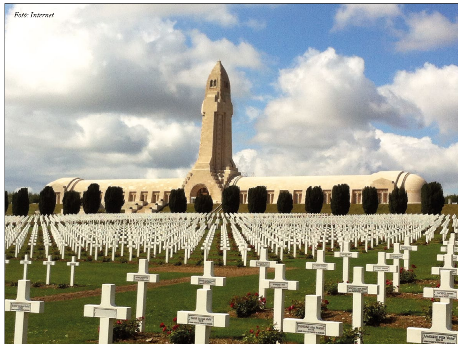
A háttérben látható az osszárium, amelyben 130 ezer katona földi maradványai vannak, az előtérben pedig 16,142 azonosított katona sírja látható.

Ezt a fedőnevet adták a németek a Verdun ellen indított támadásnak az I. világháborúban. A csata bár a háború leghosszabb ideig tartó ütközete volt (10 hónap), mégsem volt olyan döntő csata, mint Waterloo, Sedan, vagy Kuzsk. Nem volt francia szemzögből, a legtöbb áldozatot hozó, hiszen 1914 augusztusában és szeptemberében az Ardenneknben, a marne-i csatában; 1915-ben a Champagneban; 1917-ben az Aisne mentén több embert vesztettek el. Akkor miért olyan híres? Talán azért, mert az I. világháború értelmetlenségének, az anyagcsata, az állóháború borzalmainak és szűk területen lezajlott iszonyatos emberi szenvedéseknek a szimbóluma. Semmilyen politikai következménye nem volt francia oldalon, de még német oldalon sem. Erich von Falkenhayn vezérkari főnök (1914. szeptember 14. - 1916. augusztus 29.) leváltása inkább a Bruszilov-offenzíva miatt következett be.