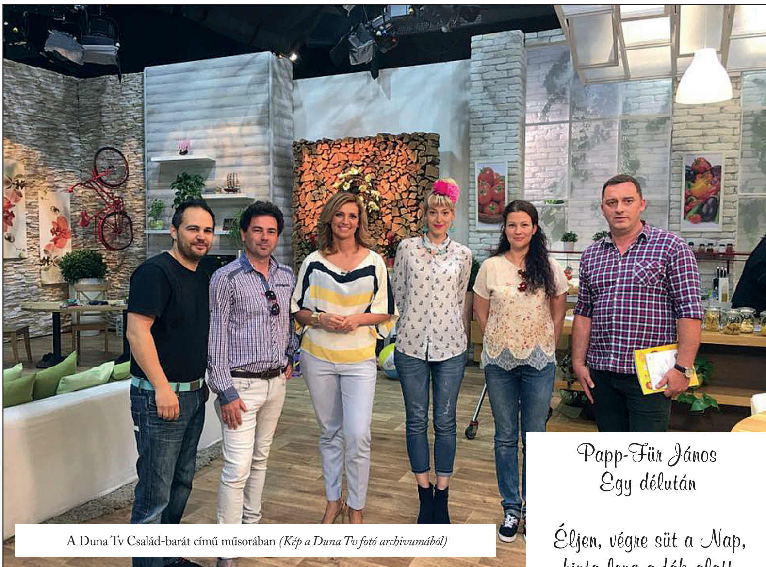
A Duna Tv Család-barát című műsorában

használható lesz az irodalom. A szakemberek tudják és be is vetik a ritmus, a zene, a mondókák sérült gyerekekre gyakorolt hatását. Ők, akik sokszor egyensúlyproblémával is küzdenek, biztos támpontot lelnek a versikékben – sokszori ismétlés, tanulás után képesek megjegyezni, elmutogatni azokat. Az, hogy milyen további tartalékok vannak ezekben a gyermekfejekben az órákon kiderült: Hajdúdorogon egy olyan gyermek eresztette el a hangját, aki más különben még nem énekelt a közösség előtt, a speciális intézmények tanulói pedig bebizonyították – amit szintén tudtak már a szakemberek –, hogy cseppet sem várnak más megközelítést, mint ép társaik, csak a módszert kell kellően hozzájuk alakítani.