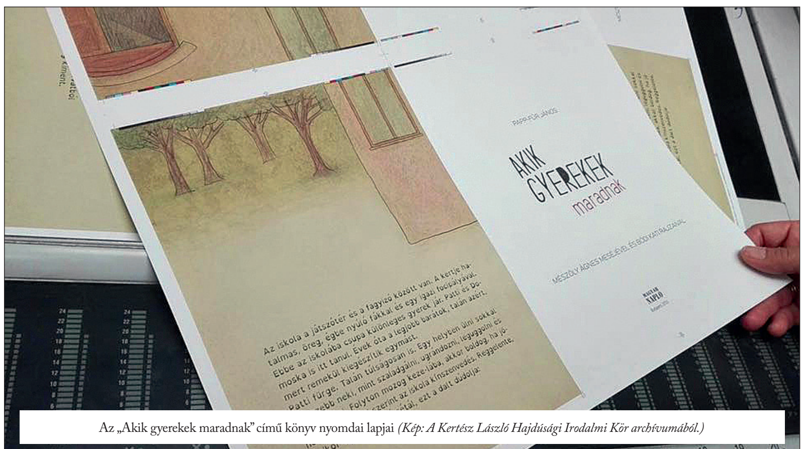
Az „Akik gyerekek maradnak” című könyv nyomdai lapjai (Kép: A Kertész László Hajdúsági Irodalmi Kör archívumából.)

Tudom és érzem, hogy a zene, a harmónia, a ritmus, a rímképzés rávezeti őket a feladatok megoldására. A velük közösen eltöltött idő pedig hozzátesz az életükhöz, számukra is