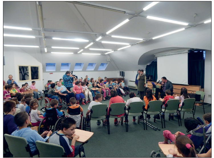
Két kép a Pető Intézetből