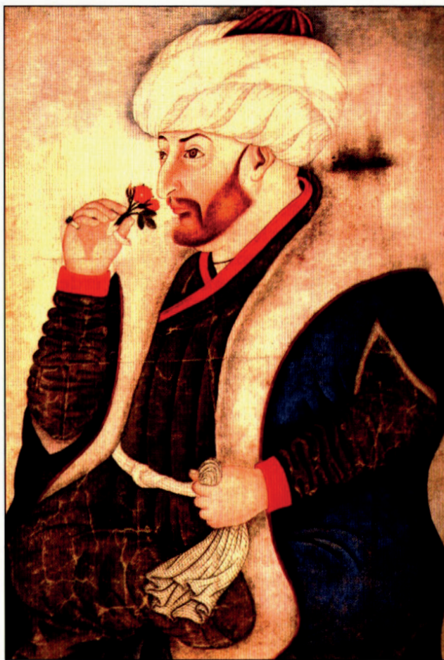
II. Mehmed török szultán

Ezekben a rajtaütésekben és dúlásokban többnyire nem gyalogos janicsárok és lovas szpáhik vettek részt, hanem török könnyűlovas akindzsik és páncél nélkül harcoló aszab gyalogosok. Céljuk nem a területfoglalás és a várívás volt, sokkal inkább csak a fosztogatás és a pusztítás. Természetesen, ha teheték, ezeket a kegyetlen beütéseket a magyar végváriak maguk viszonzták. 1479-ben, a velenceiek elleni háború végeztével, elerősödtek ezek a portyák a magyarok ellen is. Mátyás egy jelentős szervezeti változtatást hajtott végre, hogy a török betöréseket megfékezhesse. Létrehozta az Alsó Rézsek Főkapitányságát. Ennek központja Temesváron volt. Nem kevesebb, mint tizenegy vármegye tartozott a befolyása alá. Irányítójának feladatai között kapott