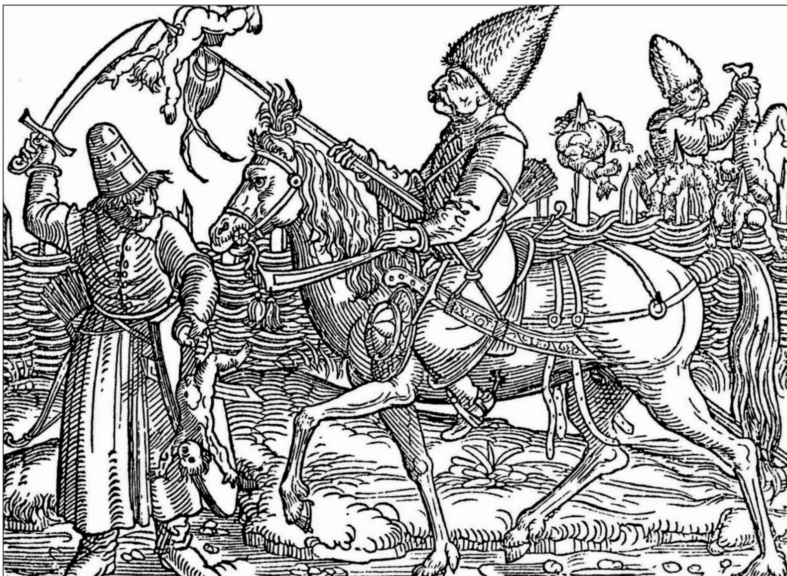
Kegyetlenkedő török martalócok

alföld és Moldva ellen. Ez a hűbéri viszony nem kevesebb, mint három évszázadig állt fenn, a tatárok és törökök közt.