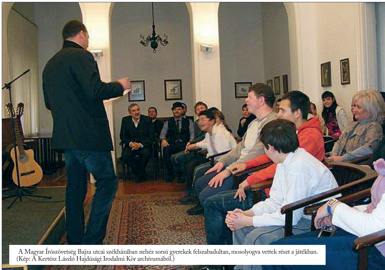
A Magyar Írószövetség Bajza utcai székházában nehéz sorsú gyerekek felszabadultan, mosolyogva vettek részt a játékban.