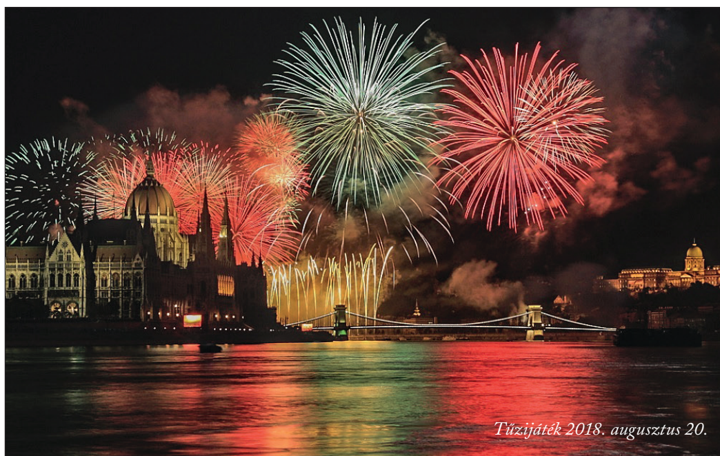
Tűzijáték 2018. augusztus 20.

pai ügyekért felelős amerikai külügyi államtitkár pár napja egy brüsszeli fórumon ezt mondta: „Magyarország egy NATO szövetséges ország, demokratikusan megválasztott kormánnyal. Egyértelműen az a célunk, hogy egyensúlyt találjunk a kapcsolatok erősítése és a jogos bírálatok között. Magyarország esetében nem működik az a módszer, hogy nem hívjuk meg, kihagyjuk, félreállítjuk, éveken át nyilvánosan bíráljuk, majd ezek után arra számítunk, hogy megőrizzük nála a befolyásunkat, és elvárjuk, hogy ilyen körülmények között továbbra is támogassa nyugati olajvezetékek építését, vagy az oroszországi szankciók meghosszabbítását.” „Követjük a klasszikus amerikai politikát: igyekezzünk nem beleszólni az EU belső vitáiba, de egyértelművé tesszük, hogy hol állunk a demokrácia és a jogállam kérdésében. Ezt a politikát fogjuk folytatni a jövőben is.”