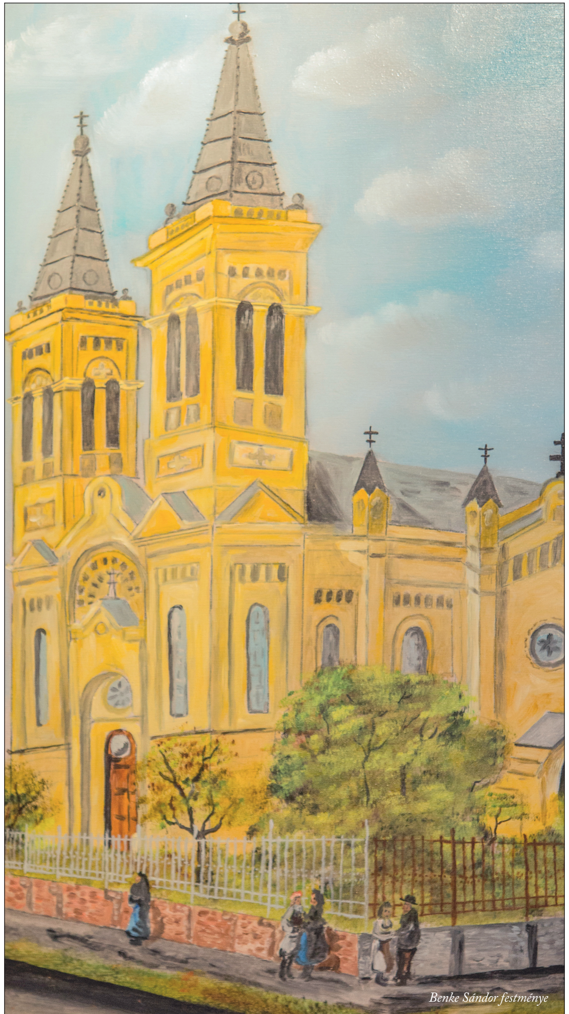
Benke Sándor festménye