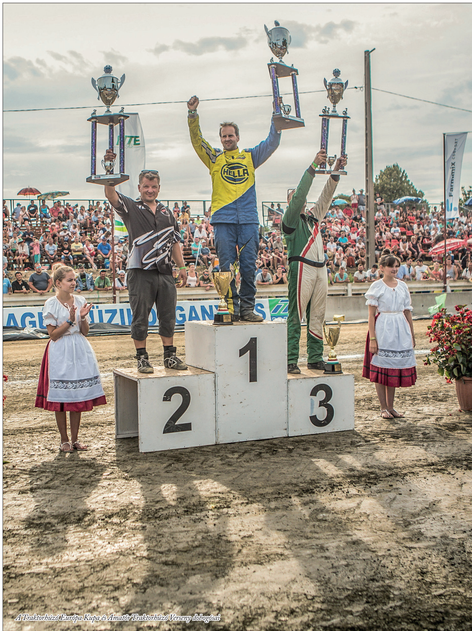
A Traktorhúzó Európa Kupa és Amatőr Traktorhúzó Verseny dobogósai