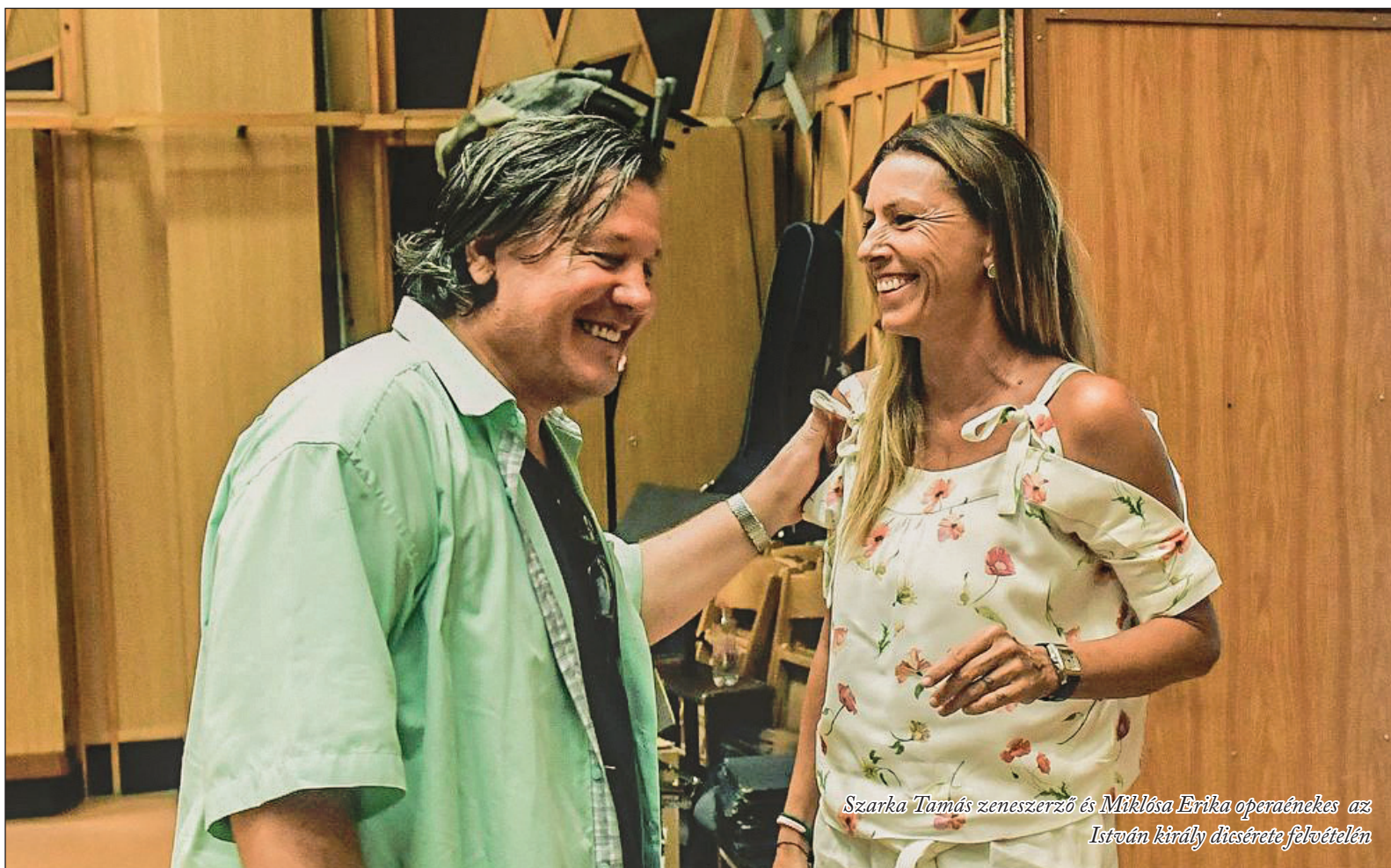
Szarka Tamás zeneszerző és Miklósa Erika operaénekes az István király díszlete felvételén

ahogy a televíziós szakemberek is professzionális szinten tették képernyőre a fényjátékot. A múltunkra utaló Csodaszarvas hosszan vágott a Parlament sötétebb kontúrjai fölött, jelezve a gyökereink keleti voltát. A Szent Korona Magyarország állami létét jelenítette meg, s a Parlament teteje fölött a kereszt Magyarország elkötelezettségét a kereszténység iránt. Mindez összhangban volt a „Csodaország Magyarország” dallamával, amely a tűzijáték elemeit is alátámasztotta és összekötötte. A Kossuth téren harminc évvel korábban hallott Internacionálé csak elvörösödvé eloldalozhatott, az új zene a nemzet lelkéből szólt, nemzetet tartott egybe, a nemzet boldog volt legnagyobb ünnepén.