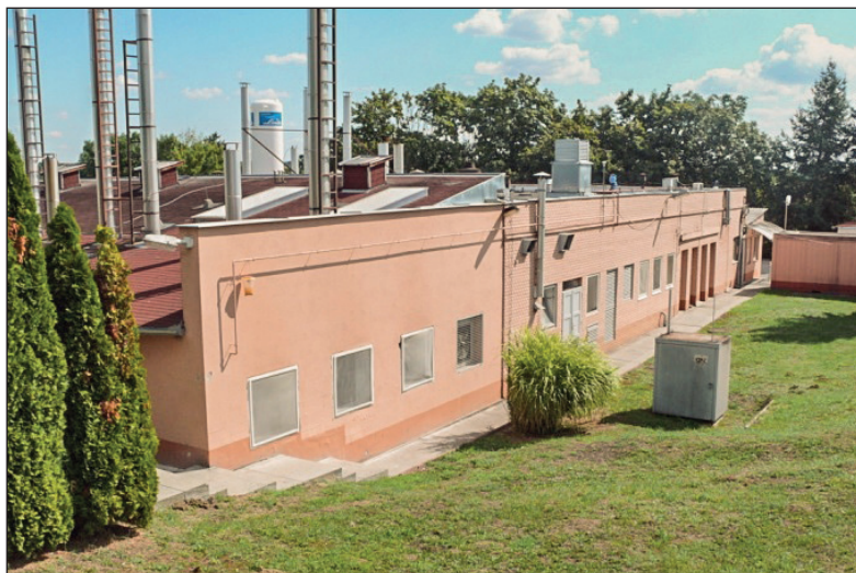
Szent Miklós vízimalom a Csele patak völgyében és a „Nemzet Kenyere” sütő „Aranycipó pékség” Pécsváradon