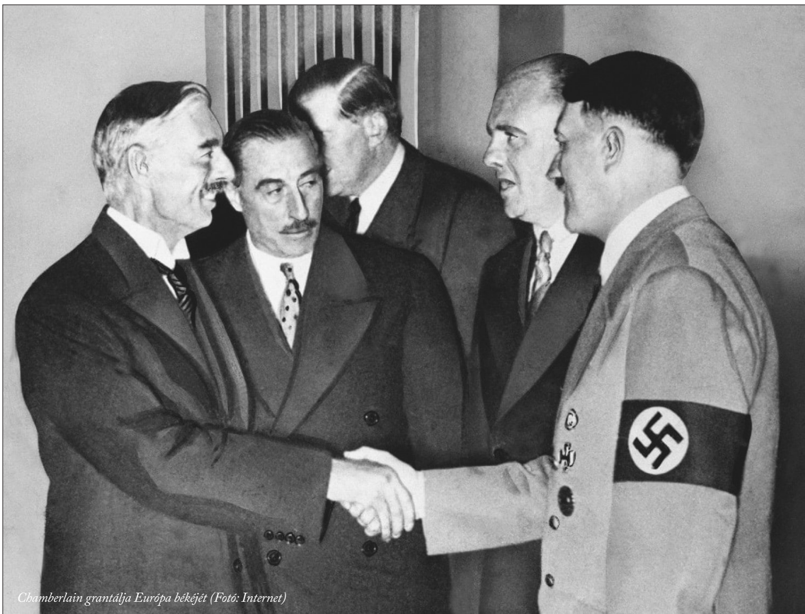
Chamberlain grantálja Európa békéjét

ken áthúzódó nagyon komoly, jól felszerelt és erős erődrendszer, és a több mint 1 millió főt számláló, jól felszerelt, és jól kiképzett csehszlovák hadsereg. Délnyugati irányból katonailag védtelenné vált ez az állam. Hitlerék még az Anschluß megvalósulását ünnepelték, amikor Eduard Beneš csehszlovák elnök (1935 óta, amikor elhunyt Masaryk) telekürtölte a világot, a nemzetközi sajtót, hogy Németország csapatokat von össze a német-csehszlovák határ mentén, és invázióra készül Csehszlovákia ellen. Erre hivatkozva a csehszlovákok mozgósítást rendeltek el május 20-án. A német vezetők fel voltak háborodva. Német kérésre, német-angol katonai bizottság járta be a határhoz közeli német térséget, és az angolok sajtótájékoztatón közölték, hogy semmilyen csapatmozgást, csapatösszevonást nem tapasztaltak német részről. Hitler ekkor rendelte el a „Fall Grün” (zöld eset) - terv kidolgozását, Csehszlovákia megsemmisítését. Az ezt követő szeptemberi hónap diplomáciai eseményei közismertek: szeptember 15. Berchtesgaden, szeptember 22-24. Bad Godesberg, szeptember 29-30. München. Tehát békés úton került Németországhoz a zömében németek lakta Szudéta-vidék. Ezt követően súlyos belső válságot élt át a Csehszlovák állam. (Nem elírás, München óta így nevezték ezt a megmaradt államot), a külső területvesztések mellett: 1./ 1938. október 2-án Teschen visszakerül Lengyelországhoz, 2./ 1938. november 2-án Magyarország visszaszerzi a tőle elvett Felvidék jelen-