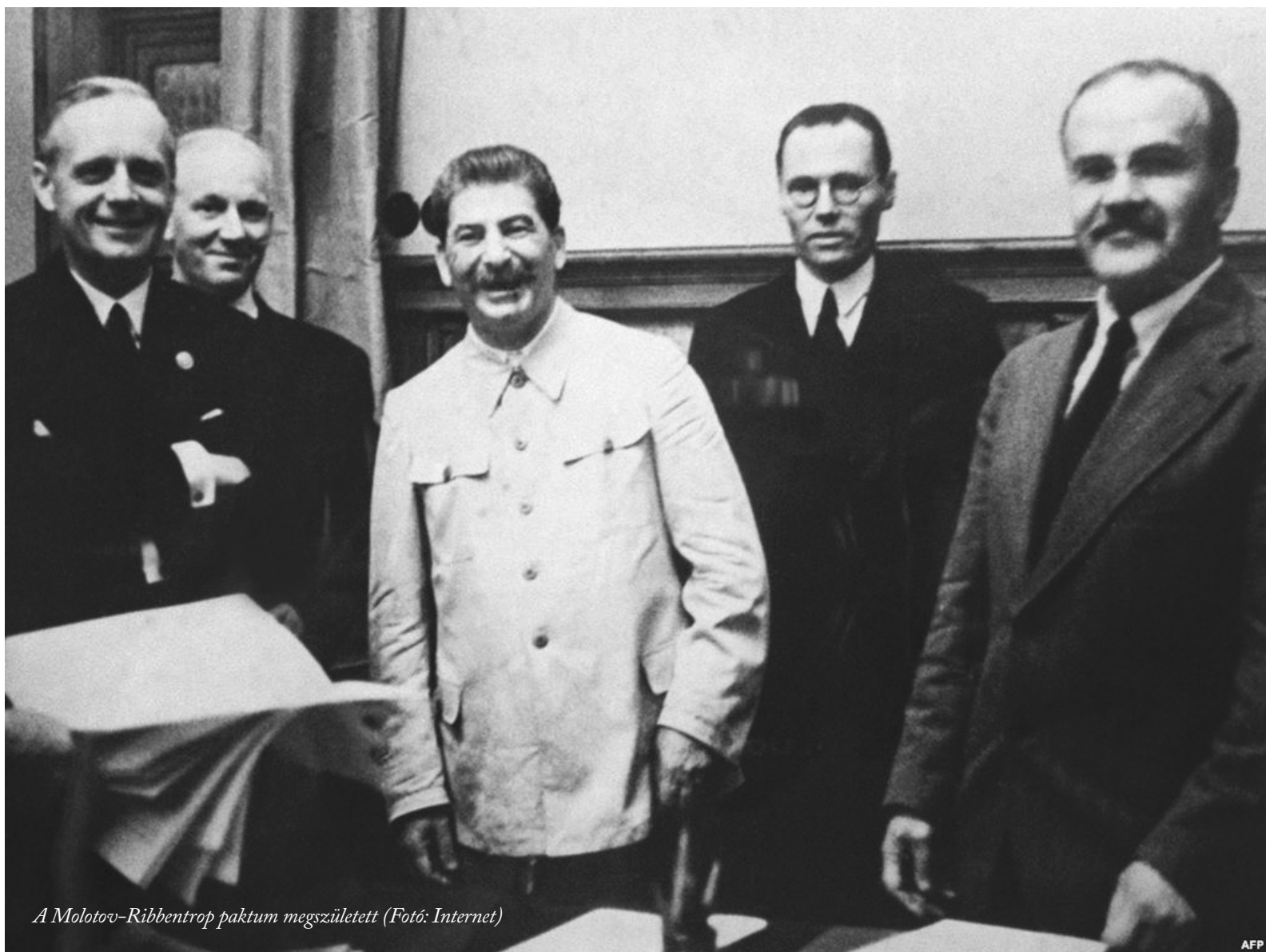
A Molotov-Ribbentrop paktum megszületett

rítsék Hitlert Danzig és a korridor kérdésében? Itt álljunk meg egy pillanatra.