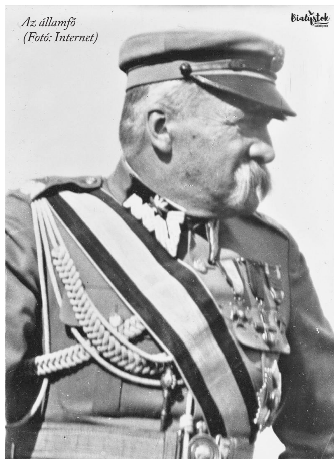
Az államfő

A csodával határos győzelem és a rend helyreállítása után az addigra nemzeti hősné kijáró tisztelettel övezett Piłsudski marsall látszólag visszavonult a politikai tevékenységtől és kizárólag katonai kérdésekkel, a hadsereg modernizálásával foglalkozott. Önként vállalt visszavonulásához nagyban hozzájárult az is, hogy 1923-ban a lengyel kormányban fő ellenfelei, a Nemzeti Demokrata Párt tagjai kerültek túlsúlyba, s ez nyilván korlátozta lehetőségeit. Érdekes módon