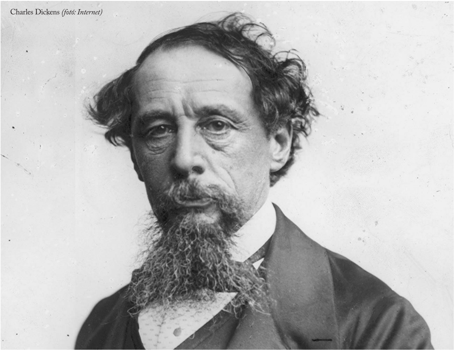
Charles Dickens

nem (de gyakran így is lenyűgözőek!). Ez a felfedezés főcímmé vált a világsajtóban és a hír az interneten is elterjedt, majd miután egy belgiumi konferencián 2015-ben bemutattam a köteteket, az „A század irodalmi felfedezése” címkét kapta. Másnap, amikor Londonba érkeztem, ott várt a BBC, a The Times, a The Guardian és a The Independent, és mindannyian velem akartak beszélni – ez volt az a 15 perc hírnév, amelyet Andy Warhol jóslt mindnyájunknak. A rengeteg izgalom és esemény után kaptam egy ajánlatot a Yale University Press-től, hogy a felfedezésemről írjak egy tudományos munkát, és gyakorlatilag egyik napról a másikra Samuel Beckett-tudósból Dickens-tudóssá váltam. Életem során olvastam már Dickens-t és nagyon szerettem is, de sosem tanulmányoztam az életét vagy bármely munkáját a tudományos karrierem során. Mégis, most, három évvel a felkérés után egy 500 és egy 300 oldalas, Dickens szerkesztői munkájáról szóló könyvem is publikálásra készen áll (nagyjából 300 minibiográfiát írtam a folyóiratához hozzájáruló írókról), illetve elkészült egy bibliografikus tanulmány is a műveinek még életében történt kiadásairól. Publikáltam három cikket a Dickensian-ben és még hármat a Dickens Quarterly-ben és Európa-szerte tartottam már sikeres plenáris előadásokat és konferencia-előadásokat – úgy, hogy korábban sosem tanulmányoztam vagy tanítottam Dickens egyetlen munkáját sem,