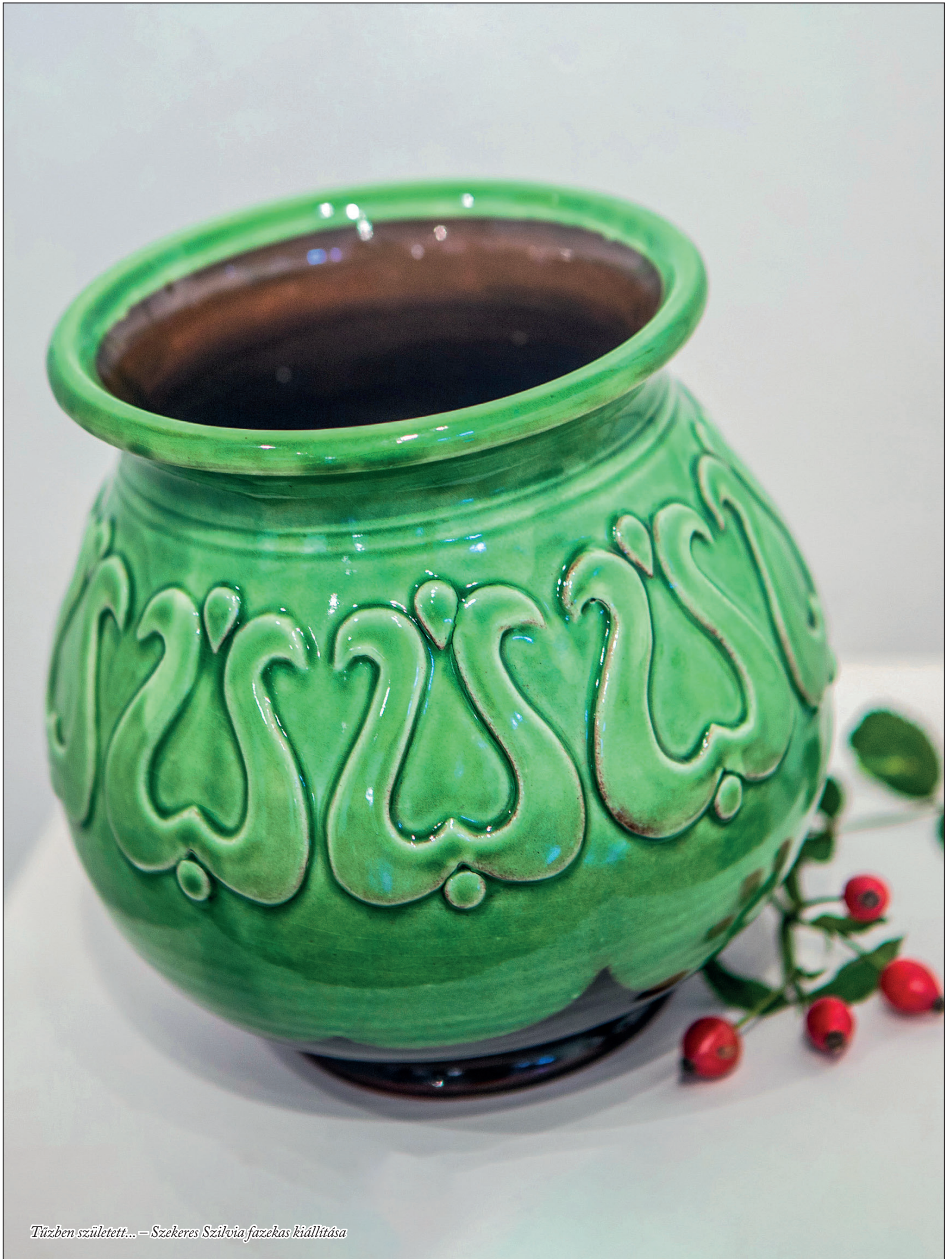
Tűzben született... – Szekeres Szilvia fazekas kiállítása