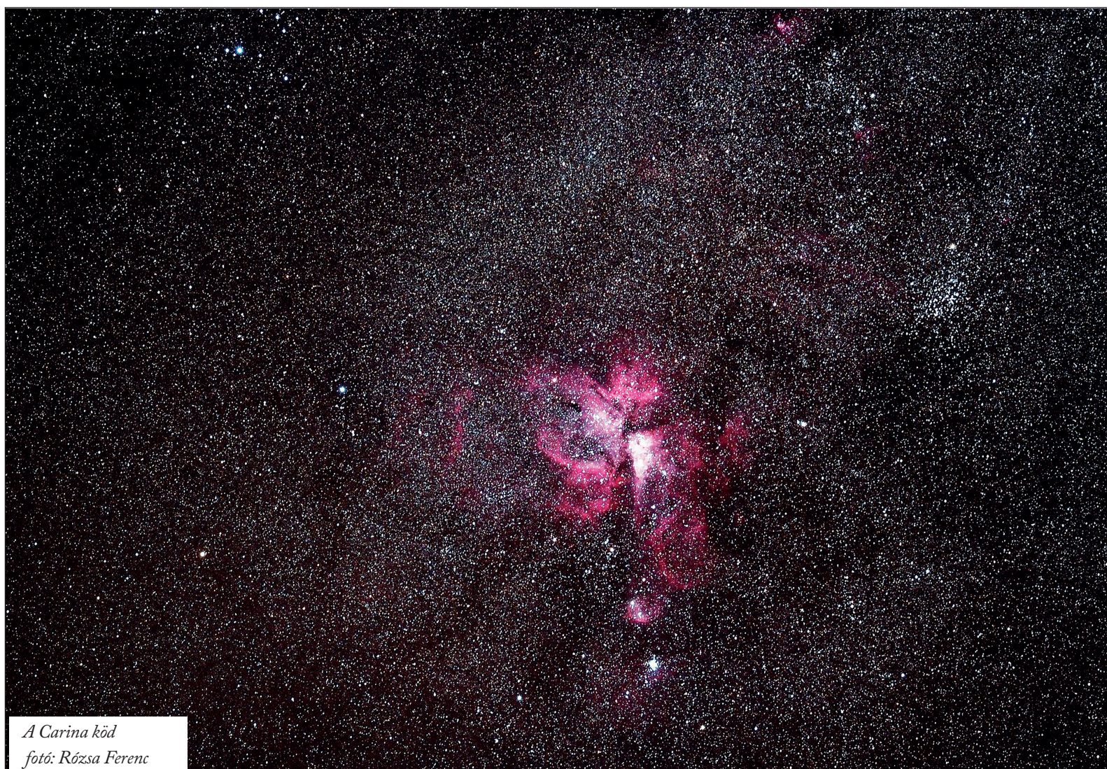
A Carina köd

Hogyan is volt a kezdetekben? A korabeli csillagjósok ismertek hat bolygót. Segítségükkel állították fel a horoszkópjaikat. Aztán csillagászok felfedezték Úránuszt és a Neptunuszt. Nem kitalálták, „csupán” felfedezték. Csillagjósaink pedig, mintha mi sem történt volna, egyszerűen beemelték horoszkópjaikba. No de akkor e két bolygó kétségtelen léte, ám nem ismerete ellenére hogyan is működhetett helyesen a hat bolygós horoszkóp?? A tudomány abban különbözik mindenfajta áltudománytól, hogy a tudomány nagyon szigorú önmagával szemben. Elég egyetlen eredmény, ami az elméletnek ellentmond, és az elmélet máris megy a levéltárak poros süllyesztőjébe.