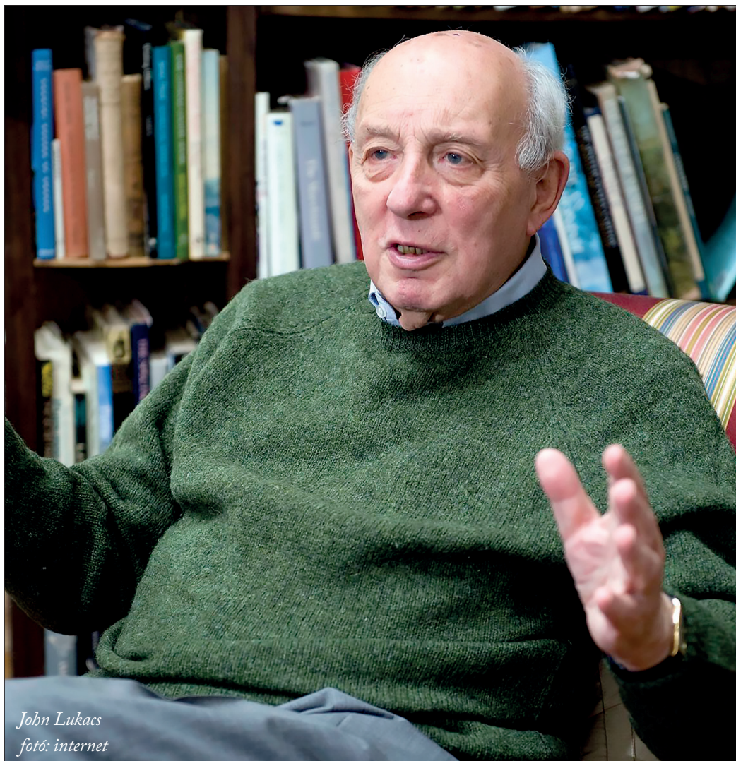
John Lukacs

Visszatérve John Lukacsához. Nos az útja Londonba vezetett Párizson keresztül. Budapesten az egyetemen három évet végzet el, majd az egyetemi tanulmányait a Cambridge-i Egyetemen fejezte be. Valószínű, hogy itt doktorált le (PHD). A disszer-