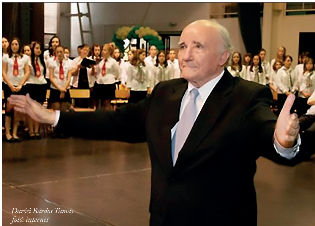
Daróci Bárdos Tamás

Kedves Mester! Drága Tamás Bácsi! Nyugodj Istenünk és szeretetünk örök békéjében!