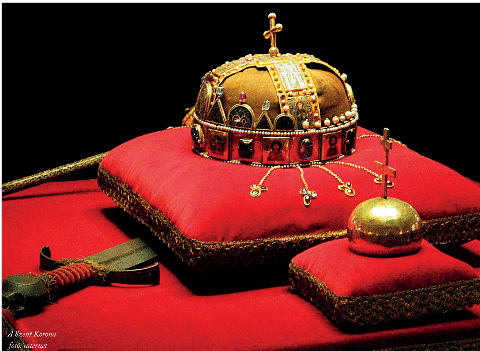
A Szent Korona

Nos, a végtelenségig sorolhatnánk a temérdek verziót, amelynek ennek a rejtélyes tárgynak (ha tárgy egyáltalán) a titkát kutatják. Zárjuk a sort azzal a legmegdöbbentőbb, de ha belegondolunk, mégis-akár a fentiek alapján is- a legkézenfekvőbb feltételezéssel, hogy a Szent Grál nem más, mint a magyarok Szent Koronája, vagy akár az általa képviselt Kárpát-medence, a gigantikus kehely. Ez ugyanis a Föld öle, ahol Isten szeretett népe él. Mesterházy Zsolt „A kelta (keleti) szellem” című könyvében így fogalmaz: „...koronánk lesz az a kehely, amelyben az isteni Ego újra meg tud születni”.