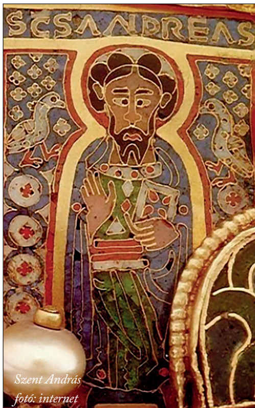
Szent András

Ugyanakkor létezik egy különös magyarázat is szent eredetűre vonatkozóan, ami ötvözi a két, egymással szöges ellentétben álló korona eredet felfogást. Az Arvisurákban, amelyet ősi rovó sámánjaink írtak, három különböző korona gondosan megtervezett és kivitelezett összedolgozására találunk utalásokat. Az első legrégebbi az uruki sámánkorona. Ez az ősmagyar vallást képviseli, és maga Gilgames készítette, majd később ajándékozták Álmos és Lebéd-házi fejedelmeknek. Másik a Dukász Mihálytól kapott zománcképes korona, amely a bizánci egyházat képviseli. A római egyház képviseletében pedig a pápától kapott liliomos arany-