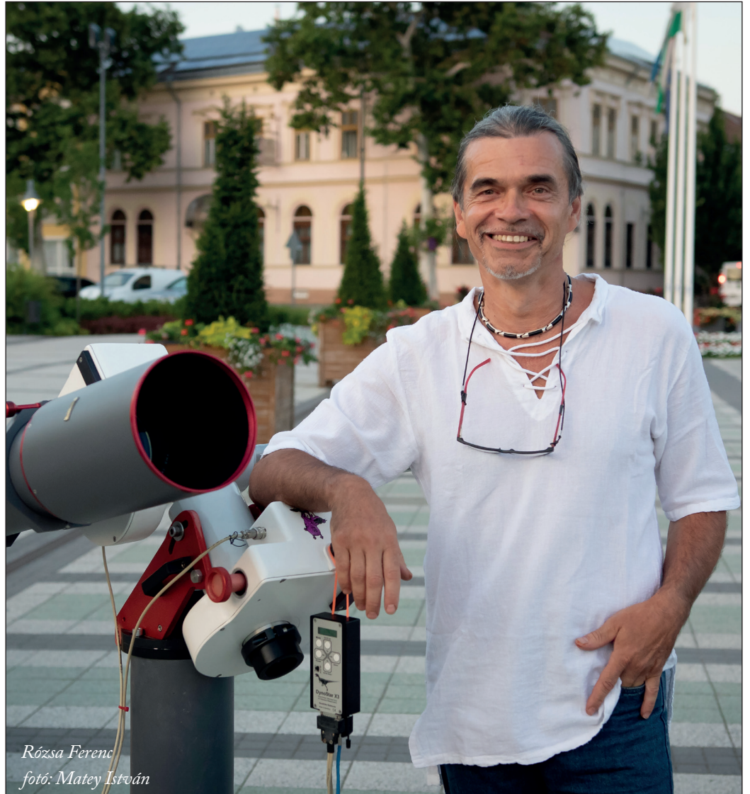
Rózsa Ferenc

Ne feledjük, a kilencvenes években még se híre, se hamva nem volt a ma már tucatszám rendelkezésünkre álló távcsöböltnak. Mindent magunknak kellett megalkotni, kigondolni. A nyugati szaklapokban látható gyári műszerek csak álom maradtak