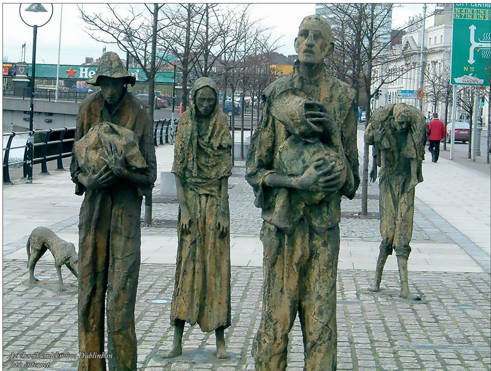
Az éhezők emlékműve Dublinban

A nagy burgonyavészt a legtöbb ír származású sem elfelejteni, sem megbocsájtani nem tudja az angoloknak, még az események után 170 esztendővel sem.