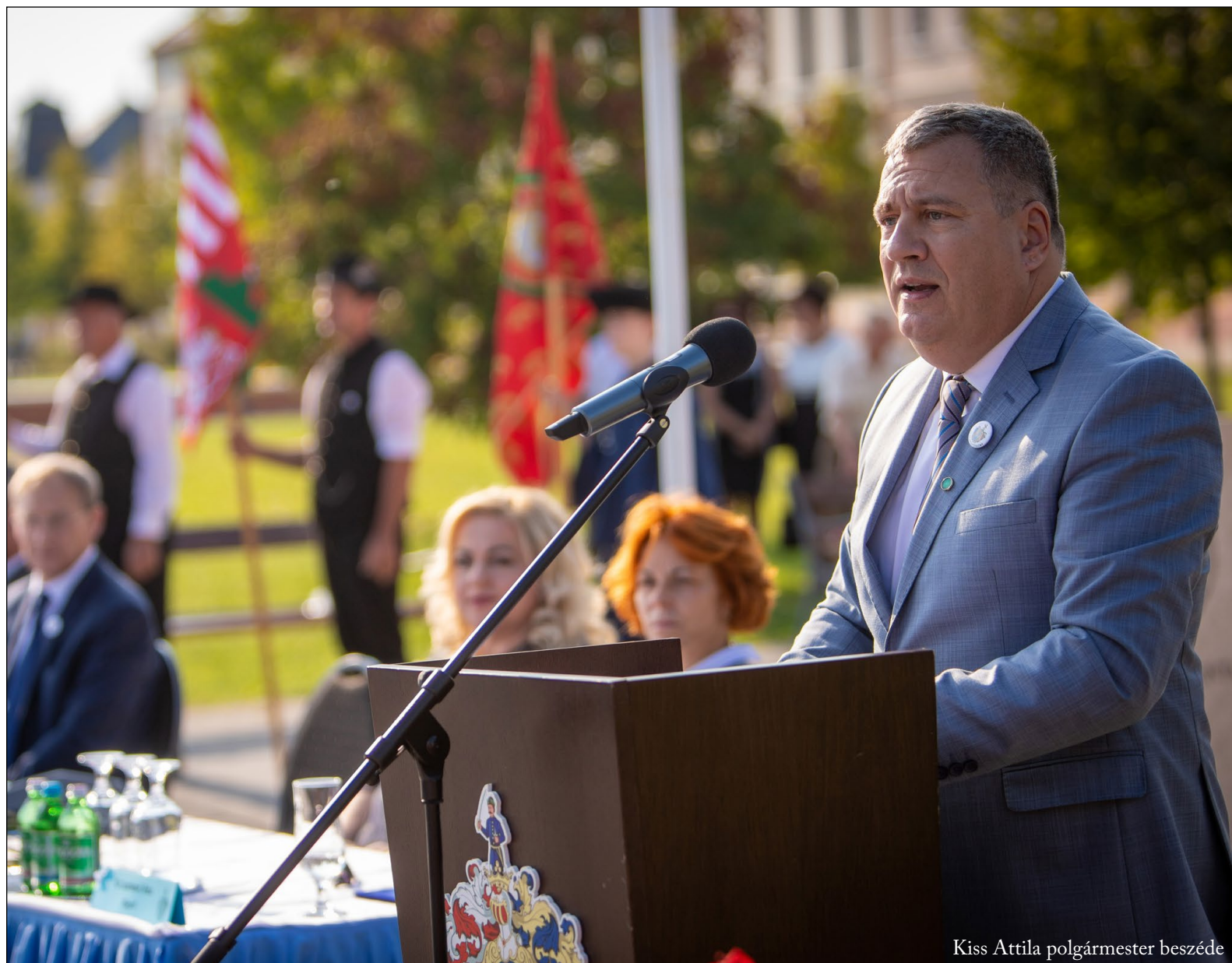
Kiss Attila polgármester beszéde