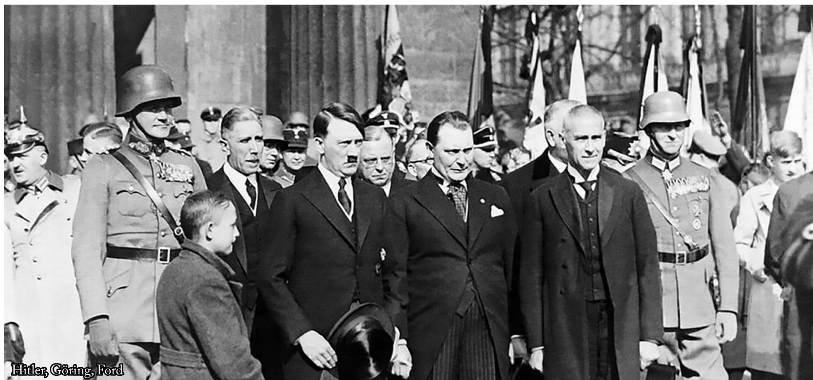
Hitler, Göring, Ford