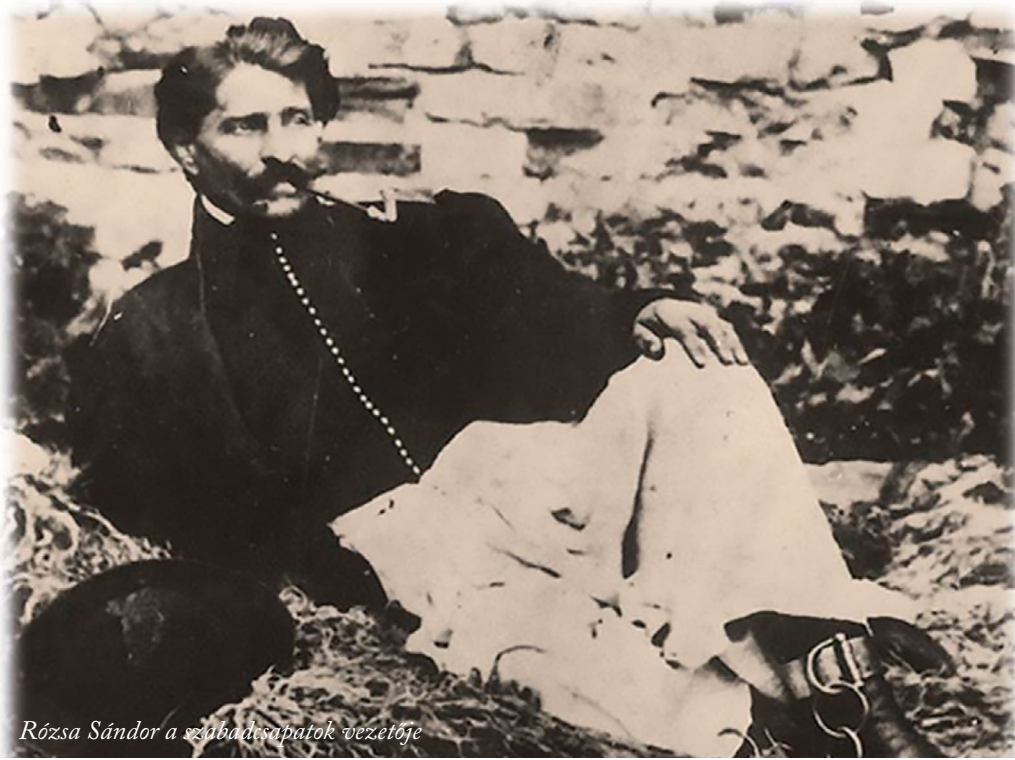
Rózsa Sándor a szabadságharc vezetője

válnak / Csapj fel öcsém katonának – választotta mottóul Arany János az „Egy életünk, egy halálunk” című másik toborzóverséhez a közhangulatot jól kifejező verbunkos részletet. Nagyszalontai élményei inspirálták ezt a versét is, hisz a hajdúvárosban hat szalontai cigányzenész húzta a talpalávalót, a verbunkost, nyolc napon keresztül, naponta nyolc váltóforint fizetségért. A toborzóitztek folyamatosan jelentették hány újoncot sikerült felszerelniük. Azonban hiába verbuváltak a Hajdúságon kívül Biharban is, a toborzást kénytelenek voltak kiterjeszteni más megyékre is, mert az nem járt kellő eredménnyel. A Hajdúkerületben a 17. huszárezred vonatkozásában szokatlan toborzással találkozunk. 1848 októberében a kerület börtönében raboskodó 24 fogoly kérelemmel fordult Kossuthoz, hogy négy év katonaságot vállalnának, amennyiben szabadon engedik őket.