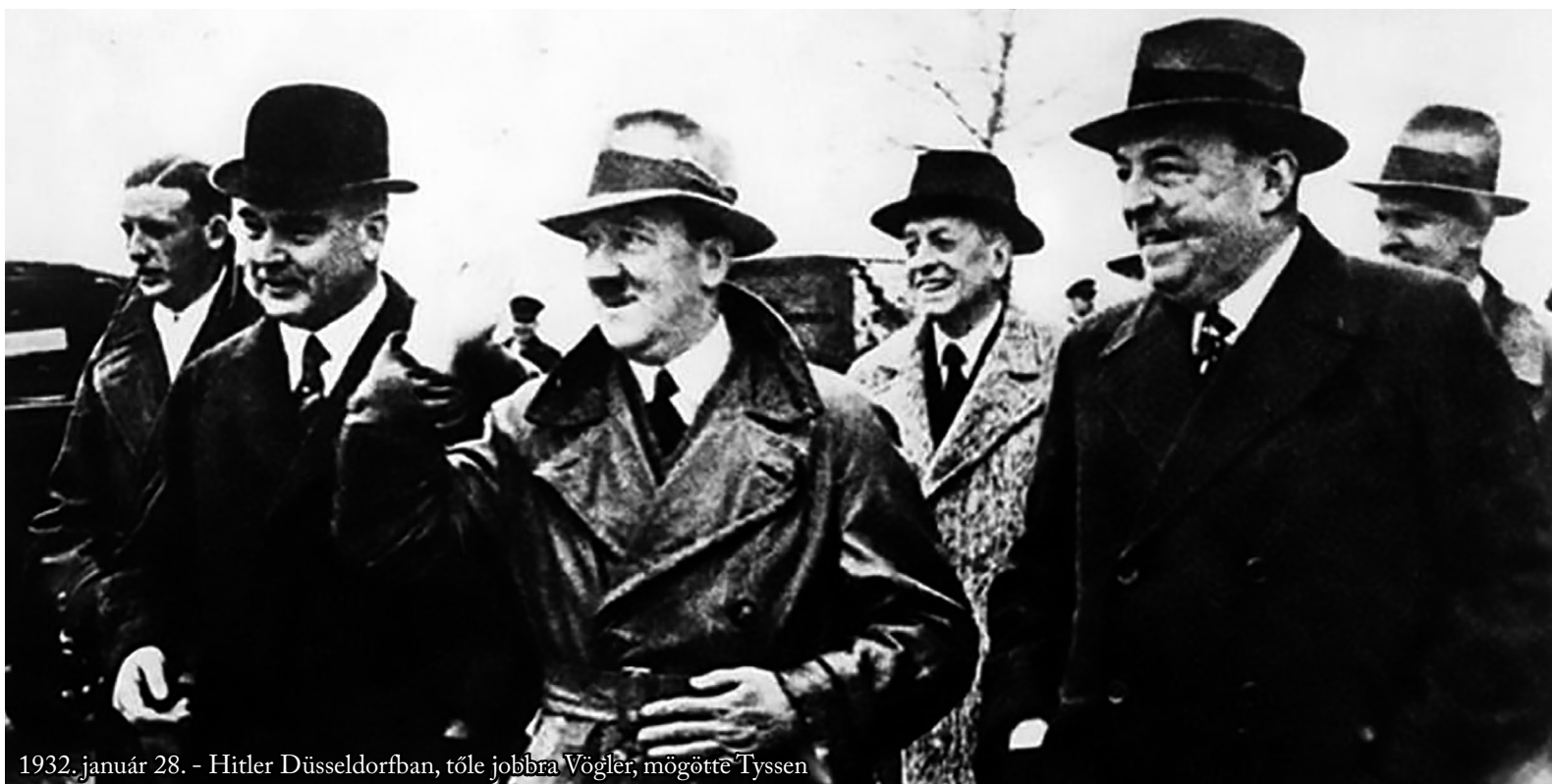
1932. január 28. - Hitler Düsseldorfban, tőle jobbra Vögler, mögötte Thyssen

Az intrikusok, összeesküvők elszámolták magukat Hitlerrel szemben. Teljesen más következett, mint amit ők terveztek. Hogy lehetett volna-e másképp? Mindenképpen.