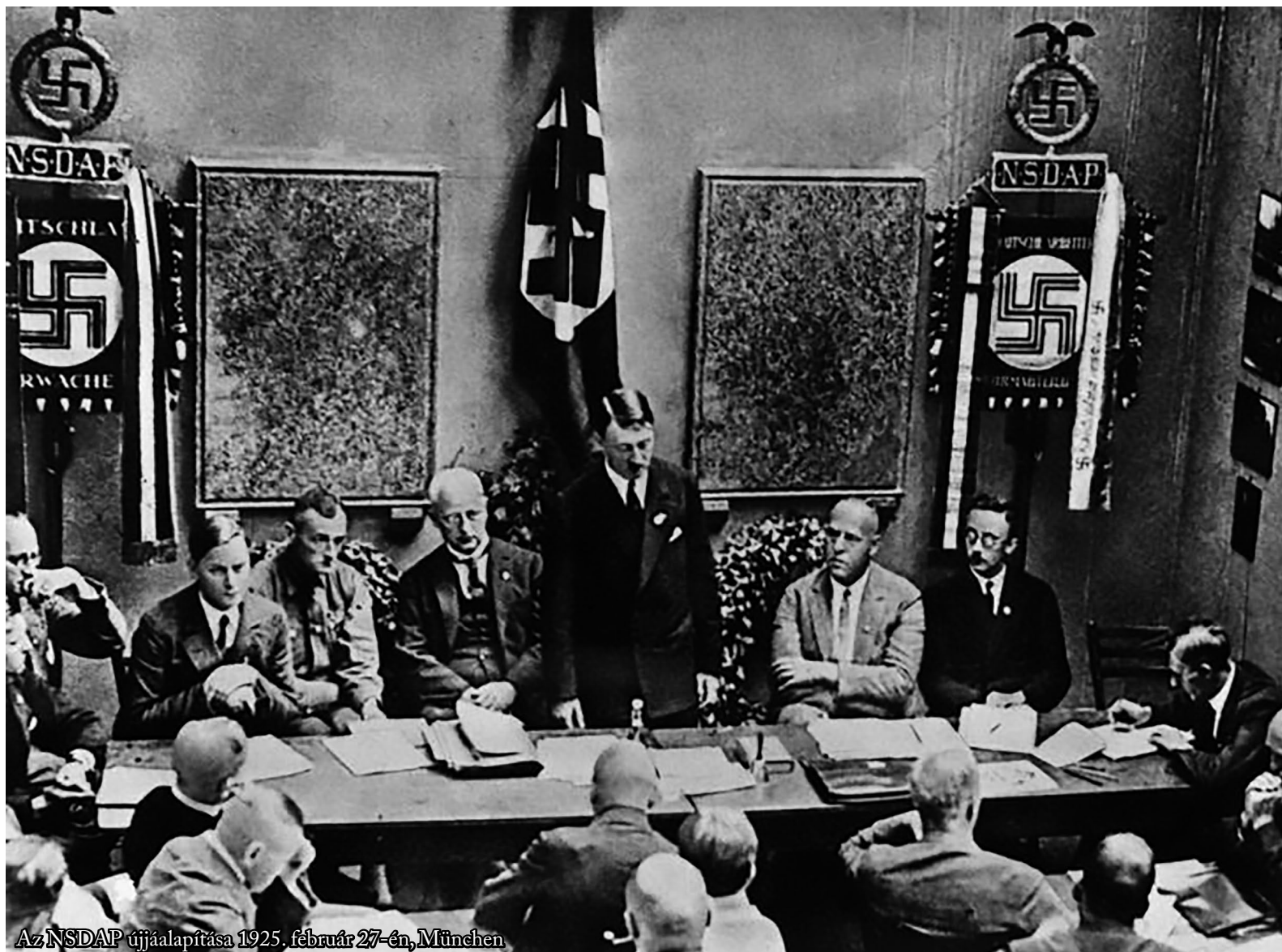
Az NSDAP újralapítása 1925. február 27-én, München

Az alábbi írásban nem azt vizsgáljuk, hogy miként alakultak a Weimari Köztársaság parlamenti választásai, és hogy ebben hogyan szerepeltek a nemzetiszocialisták, kik, azaz milyen társadalmi rétegek, csoportok, az ország mely részéről, milyen egyházhoz tartozók adták le voksukat rájuk. Sokkal inkább az érdekel bennünket, hogy konkrétan kik, és mely gazdasági csoportok támogatták, akár Németországon belül, vagy külföldről őket. A kommunista propaganda meghatározásai, amelyekben definiálják a támogatókat, azt, hogy kiknek az érdekében jött létre, és működött, kinek az érdekeit szolgálta a fasizmus, itt csak egy rövid áttekintést adunk. Klasszikus példája ennek, hogy a Komintern VII. kongresszusán, a bolgár Dimitrovtól származik a fasizmus definíciója. Nos nem tőle származik, és nem akkor született a definíció, hanem a Komintern VB 1933. decemberi plénumán fogalmazták meg. Dimitrov ekkor a Reichstag-per kapcsán Németországban, Lipcsében börtönben ült, mint vádlott. Tehát a meghatározás szerint: „A hatalmon lévő fasizmus a finánctóke legreakciósabb, legsovínisztabb, legimperialistább elemeinek nyílt terrorista diktatúrája.” Néhány megjegyzés ehhez. Ami Németországban volt, az nemzetiszocializmus, fasizmus Olaszországban létezett. A támogatókról pedig épp az alábbiakban fejtjük ki gondolatainkat.