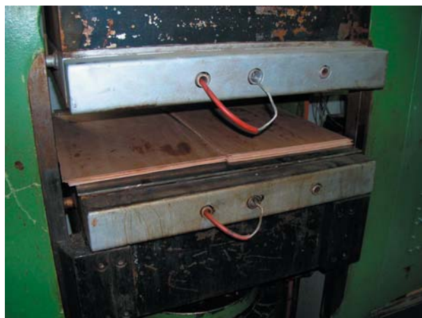
1. ábra – az elkészült lemezek a laboratóriumi présberendezésben

A lemezek préselés utáni leszorítása hatásának vizsgálatához összesen 14 próbatest elkészítésére került sor. A lemezek elkészítéséhez 480x300 mm lapméretű, 1,2 mm vastagságú, hossz- és keresztzsalú furnérokat használtunk. A furnérokat a préselés előtt több hónapig a laboratóriumban tároltuk, nedvességtartalmuk 5 és 8,5% között változott. A lemezekhez a furnérokat véletlenszerűen válogattuk. Az elkészített lemezek 9 rétegűek voltak, a szomszédos rétegek merőlegesen egymásra, és a külső rétegek a hosszanti oldallal párhuzamosak. Ragasztóanyagként Lendur 120 karbamid-formaldehid műgyantát használtunk, 16% rozsliszt töltőanyaggal. Edzőként 4 % ammónium-klorid (NH 4 Cl) katalizátort alkalmaztunk, 25%-os oldatban. A préselést egy Siempelkamp laboratóriumi hőprésben végeztük, 1,8 MPa nyomáson és 130°C hőmérsékleten, a présidő 15 perc volt. (A présidő kiszámítását tapasztalati képlettel végeztük.) Az elkészült, még a présben levő próbatesteket az 1. ábra mutatja.