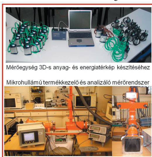
2. ábra. Energia-precíziós mérőegységek

Az energia-precíziós technológiák kidolgozását megalapozó kutatómunkák főként a hőtechnikai berendezések és technológiák, valamint a termékkezelési eljárások új szemléletű mérési és értékelési módszerek alkalmazásával valósulnak meg.