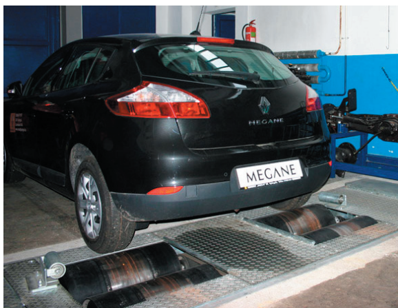
8. ábra: Görgős teljesítménymérő fékpad