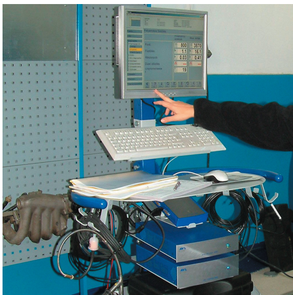
7. ábra: AVL DIX motordiagnosztikai berendezés

A járműtechnikai laboratóriumban korszerű görgős teljesítménymérő paddal és gépjárművek műszaki méréseihez alkalmas mérőpaddal (fékhatás-mérés, kormány szerkezet-vizsgáló, lengéscsillapító-vizsgáló) rendelkezünk. A görgős fékpaddal személygépjárművek kerekei leadott teljesítmény határozható meg.