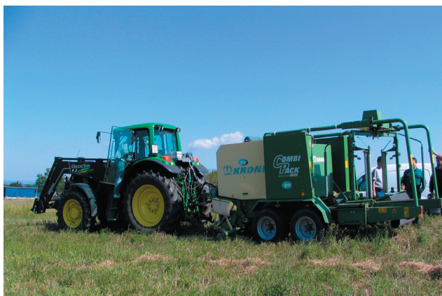
9. ábra: Szabadföldi járművizsgálat

A bemutatott mérés technika és a tanszék szakmai tudományos háttere – a fenti példákon kívül is alkalmas a motor- és járműtechnika terén számos vizsgálat, fejlesztés, szaktanácsadás és tanfolyami oktatás megvalósítására.