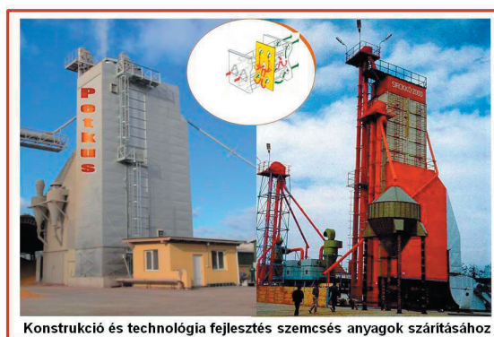
3. ábra. Új és továbbfejlesztett szárítóberendezések

A technológia- és konstrukciós fejlesztések tárgya körébe tartozó K+F+I tevékenységünk elsősorban új kalorikus eljárások és berendezések kidolgozásához, illetve a meglévők továbbfejlesztéséhez szükséges szakértői, szakatanácsadói munkákat szolgálja.