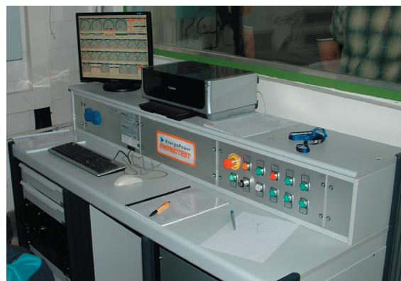
6. ábra: A fékpad vezérlője