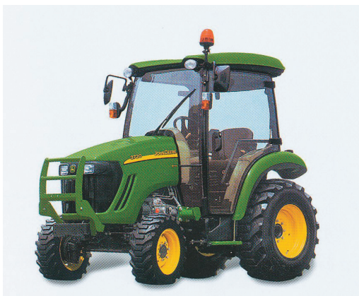
3. ábra. Kommunális traktor

A kommunális traktor 22 kW teljesítményű vízhűtéses dieselmotorral, elektronikusan vezérelt fokozatmentes, hidrosztatikus kommunális hajtóművel, kapcsolható elsőkerék hajtással, hátsó erőleadó tengellyel rendelkezik. A traktor alatti kasza meghajtó erőleadó tengellyel, a traktor jobb oldalán középen 2 pár, a traktor hátulján 1 pár – kettős működésű – vezérelhető hidraulikus gyorscsatlakozóval, elektronikus üzemóra számlálóval, közúti vizsgára alkalmas kivittel bír.