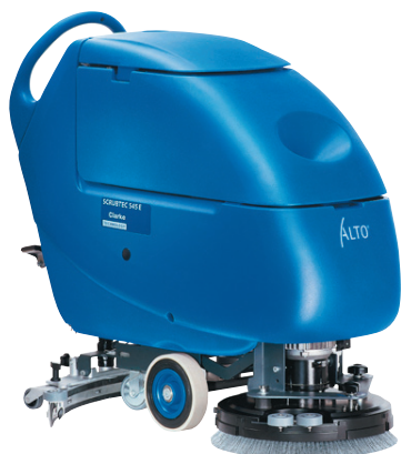
4. ábra. Önjáró takarítógép

A felsorolt eszközök alkalmasak a mezőgazdasági és élelmiszeripari gépészmérnökképzésben történő felhasználáshoz, valamint a kommunális gépek oktatásához. A teljes kiépítéssel rendelkezésre álló eszközök teljes értékű munkavégzésre is használhatók, amelyek lehetővé teszik a kutatási feladatokhoz kapcsolódó szántóföldi, valamint egyéb terepeken való kísérleti feladatok megoldását is.