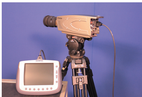
5. ábra. OLYMPUS i-SPEED TR gyorskamera

A diagnosztika laboratórium felszerelése közé került egy nagy rögzítési sebességű (1280x1024 felbontás mellett 2.000 fps a rögzítési sebesség esetén, a maximális rögzítési sebesség 10.000 fps) kamera is.