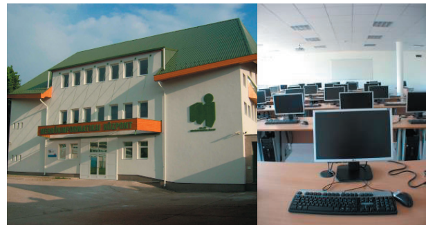
1. ábra. A felújított Mérnök-informatikai Központ

Néhány évvel a Tudástranszfer Központ kialakítását megelőzően jelentős laboratóriumi felújítás és bővítés eredményeként jött létre a Mérnök-informatikai Központ.