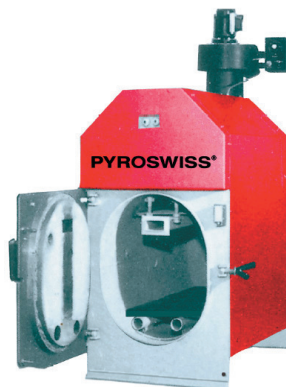
Faelqázósító rendszerű kazánok