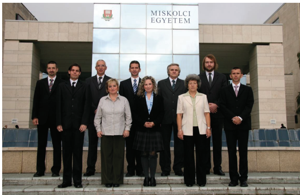
A Vegyipari Gépek Tanszékének munkatársai 2012. októberében

Cím: H-3515 Miskolc-Egyetemváros Tel/fax: +36 (46) 565-168 E-mail: gkvgt@uni-miskolc.hu Web: vgt.uni-miskolc.hu