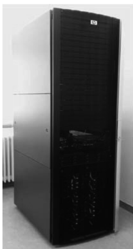
3. ábra. A berendezés a szerver helyiségben

Az operációs rendszer telepítése után következett a rendszer finomhangolása. A három hónapig tartó optimalizálási munka végén sikerült elérni - a kezdetben nem is remélt - igen figyelemre méltó, 3 teraflops ( 3 \times 10^{12} lebegőpontos művelet másodpercenként) számítási teljesítményt, amellyel igen előkelő helyet foglalunk el a Magyarországon található szuperszámítógépet üzemeltetők elit klubjában.