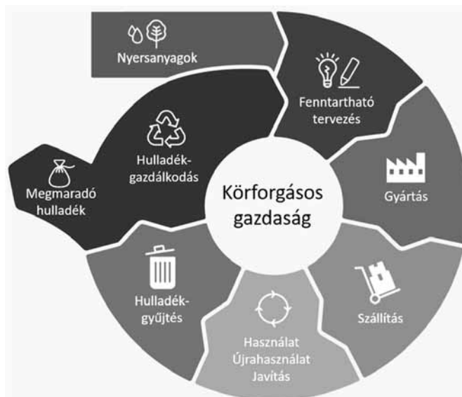
1. ábra. A körforgásos gazdaság modellje [1]

visszaszorítása áll azáltal, hogy egy zárt körben keringtetjük őket. Bizonyos megoldások, mint például az újrahasználat, vagy a javítás meghosszabbítják a termék életciklusát, míg a felújítás, vagy az újrahasznosítás javítja az erőforrások kihasználását. A körforgásos gazdaság ezeknek a stratégiáknak a kombinációját alkalmazza. [2]