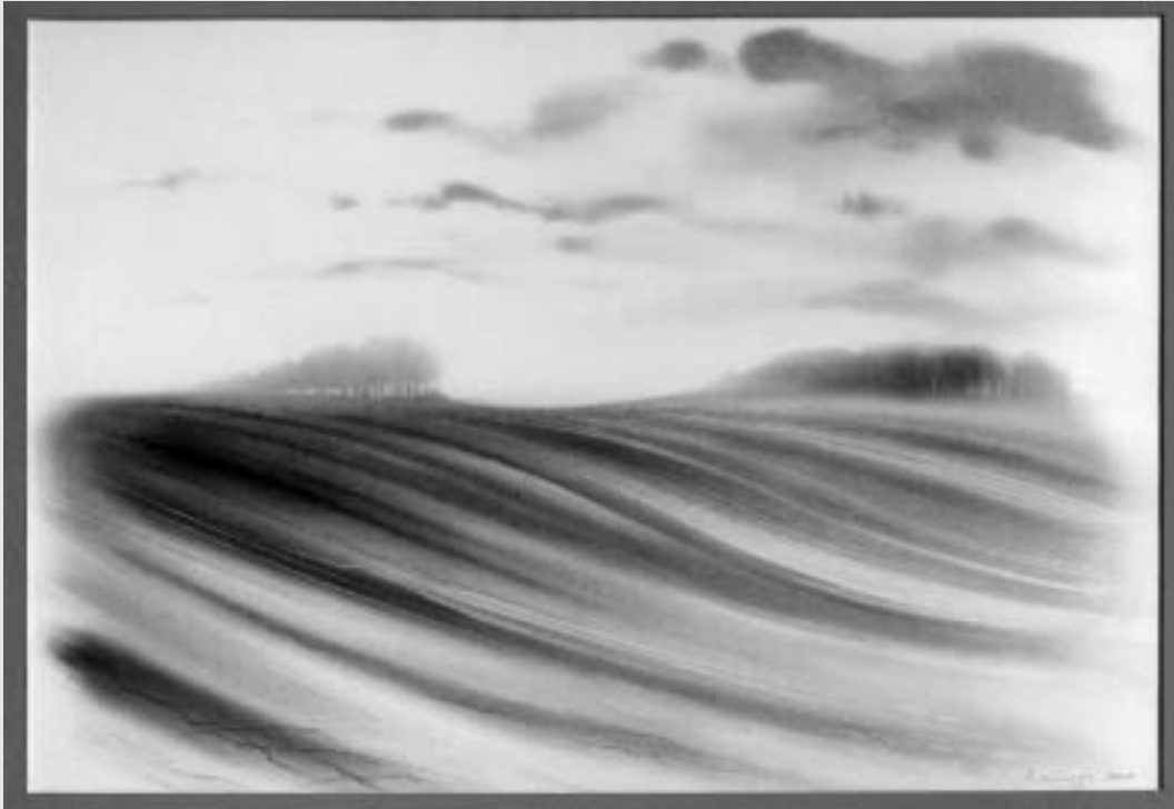
Melega István: Felsőrajki dombok