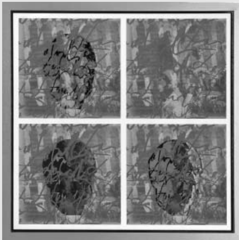
Stangler Lajos: Laudatio Funebris