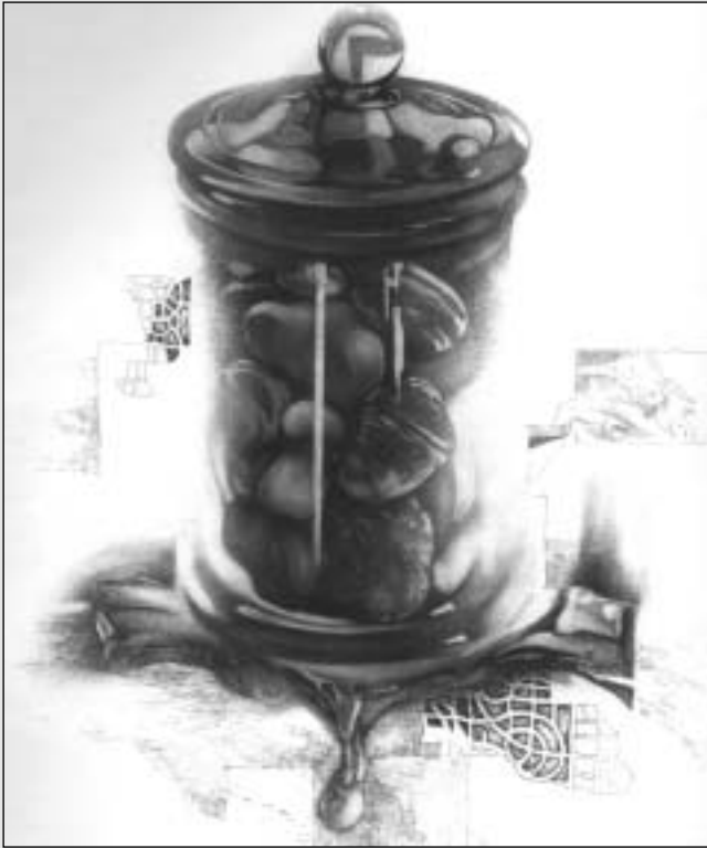
Fimmel Gyula: Nem szimmetria