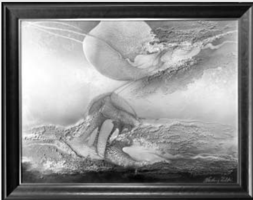
Ludvig Zoltán: Éltető nap