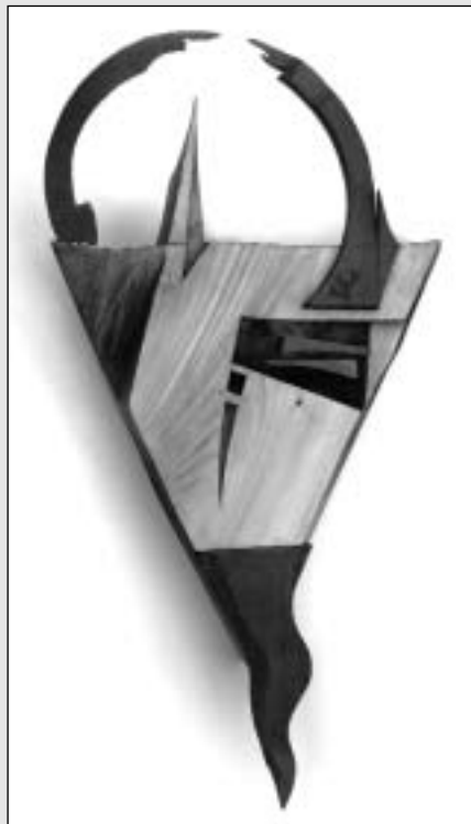
Németh Dezső: Gyökerek