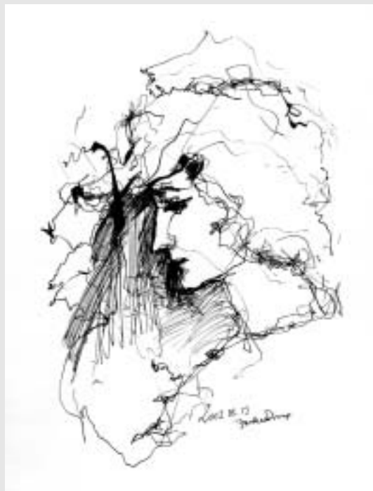
Farkas Zsuzsa: Egy nő