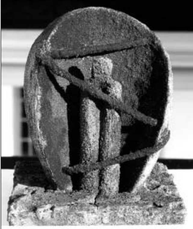
Horváth László: Fogoly