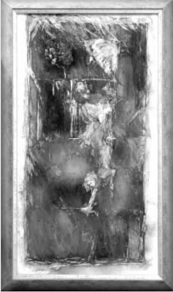
Ágh Edit: A pillanat műve