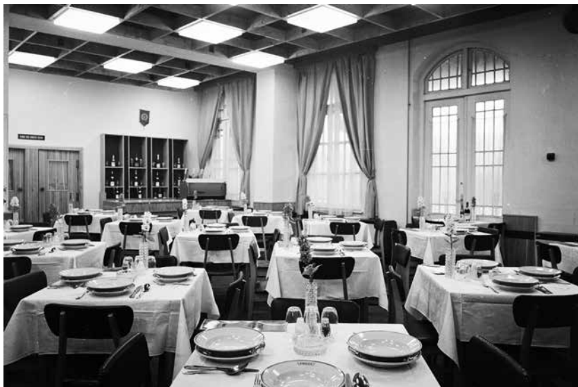
Az 1971-ben felújított zalaegerszegi Resti vendégtere