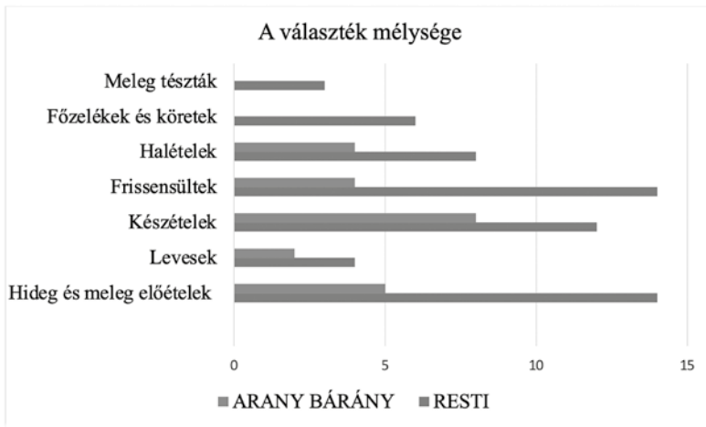
1. ábra: Versenytársak, 1963

Tóth Tibor, a Resti konyhavezető szakácsa, a régi jó szakemberek egyike, a szakásos receptúrák mellett 60-70 db saját receptet is beforgatott a kínálatba, változa-