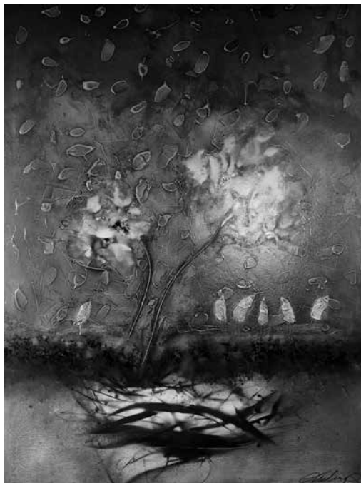
LUDVIG ZOLTÁN: Evolution

A művésznak a természetből vett motívumokat feldolgozó festményein jobbára nem a konkrét valóság jelenik meg, hanem egy olyan képzelte világ, aminek elemei a világmindenség szinte molekuláris szintű, valamint az emberi szervezet sejtig hatoló természettudományos ismeretéről árulkodnak. E tematikákat a művész amorf struktúrákba rendezve tárja a műveit szemlélők elé, akiket az ismerős elemek ismeretlen viszonylatokban való szerepeltetése arra ösztökéli, hogy figyelmet szentelve a kisugárzással rendelkező alkotás kifejezéstartalmára, azon elgondolkozzanak.. Az álom vagy valóság dilemmája annak folyamánként merült fel, hogy a nagy mesterségbeli tudással létrehozott, objektívnek tűnő látvány a határozott kompozíciós váz ellenére