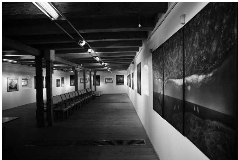
LUDVIG ZOLTÁN: Kiállítási enteriőr I.

Festményeit szemlélve, hol a tenger mélyén készült bűvárképekre, hol az emberi szervezetbe hatoló szenzor felvételeire, olykor növényi vegetációk részleteire asszociálhatunk. Természetesen minden szemlélőben más és más hatást, emlékképet válthatnak ki munkái. Ugyanakkor általános érvényű lehet az a megállapítás, hogy részletgazdag