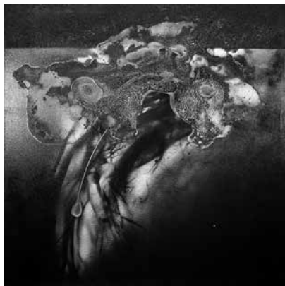
LUDVIG ZOLTÁN: Univerzum