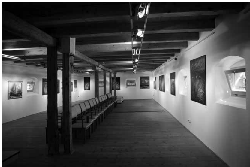
LUDVIG ZOLTÁN: Kiállítási enteriőr II.

latos nézeteit: „...Szeretem szabadon használni az anyagot, ami azt jelenti, hogy minden képem vegyes technikájú. Különböző összetételű anyagokkal indítok, gyakran használok ipari festékeket is. Hagyom, hogy azok, bár irányítottan, de önálló életet éljenek. A tudatosságom annyi, hogy ezzel már megalapozom azt a motívumvilágot, ami engem foglalkoztat. Ezáltal a képeim bizonyos részletei improvizatívnak tűnnek. ...”