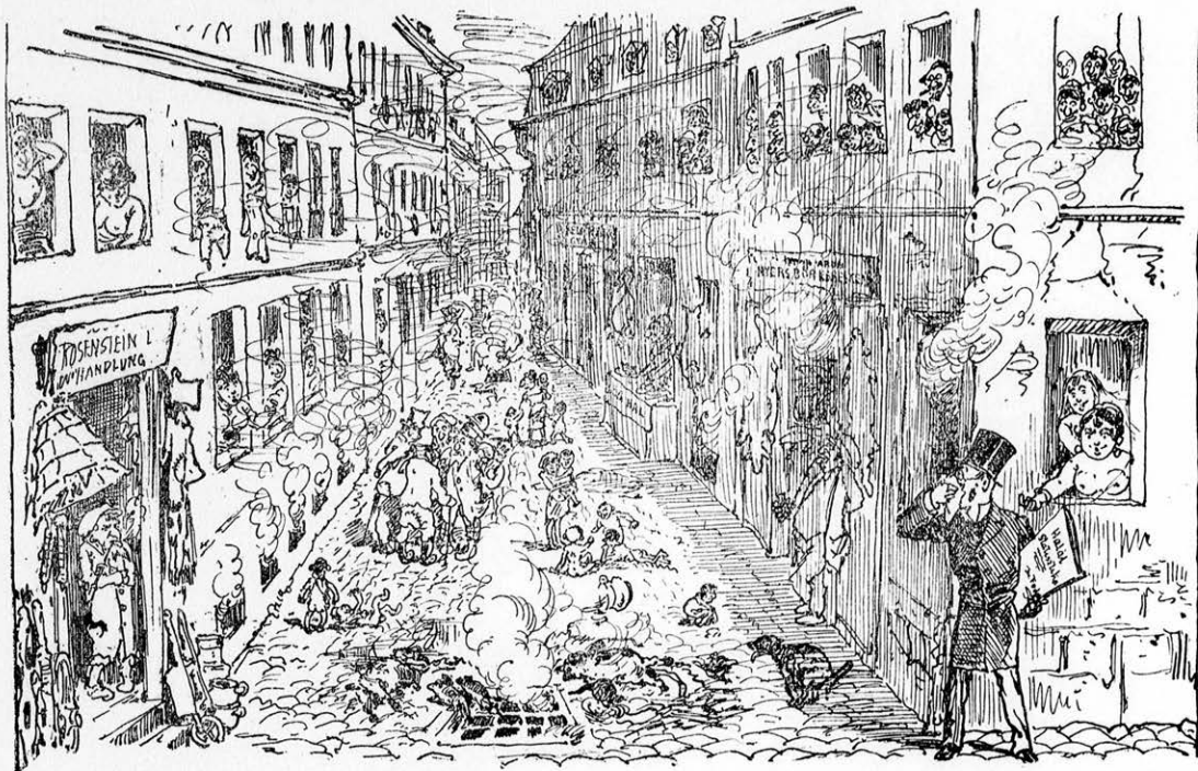
Részlet a sugár-út melletti kétszerecsen-utczából.