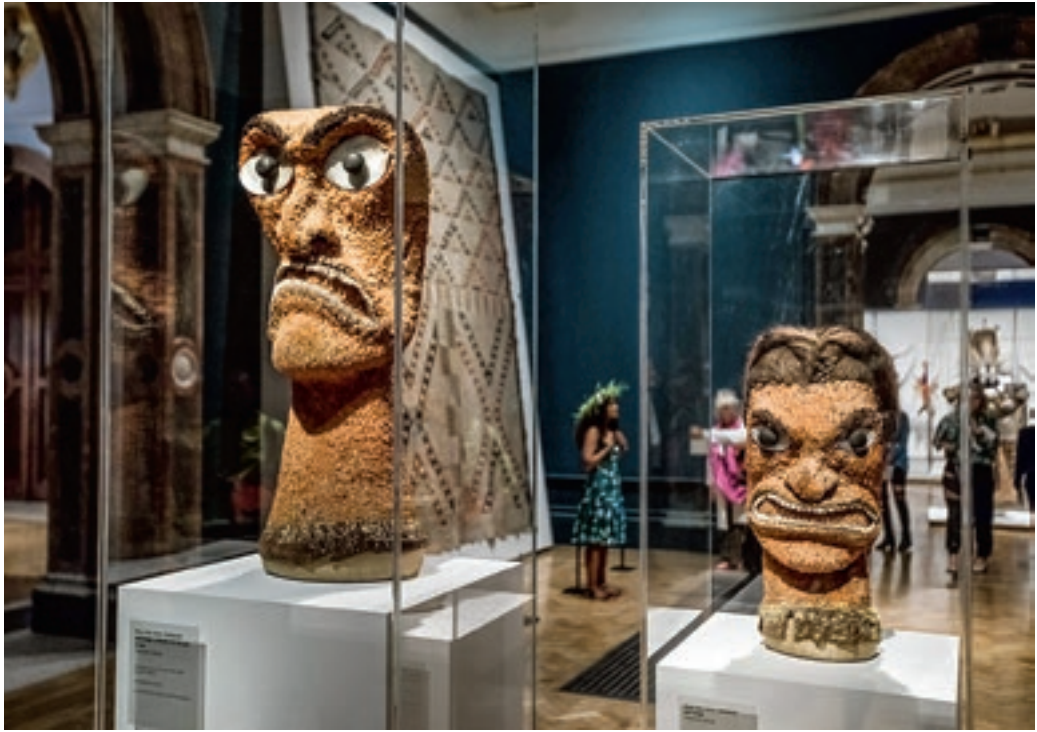
Részlet az Óceánia kiállításból David Perry © Royal Academy of Arts