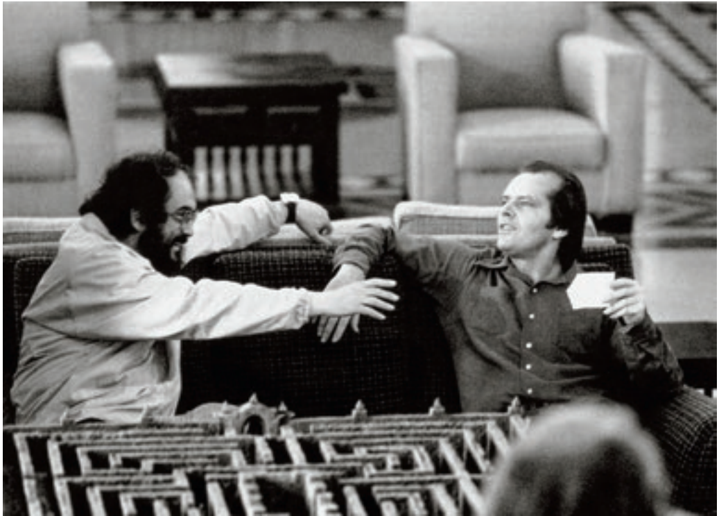
Ragyogás, rendezte: Stanley Kubrick Stanley Kubrick és Jack Nicholson a forgatáson 1980-ban