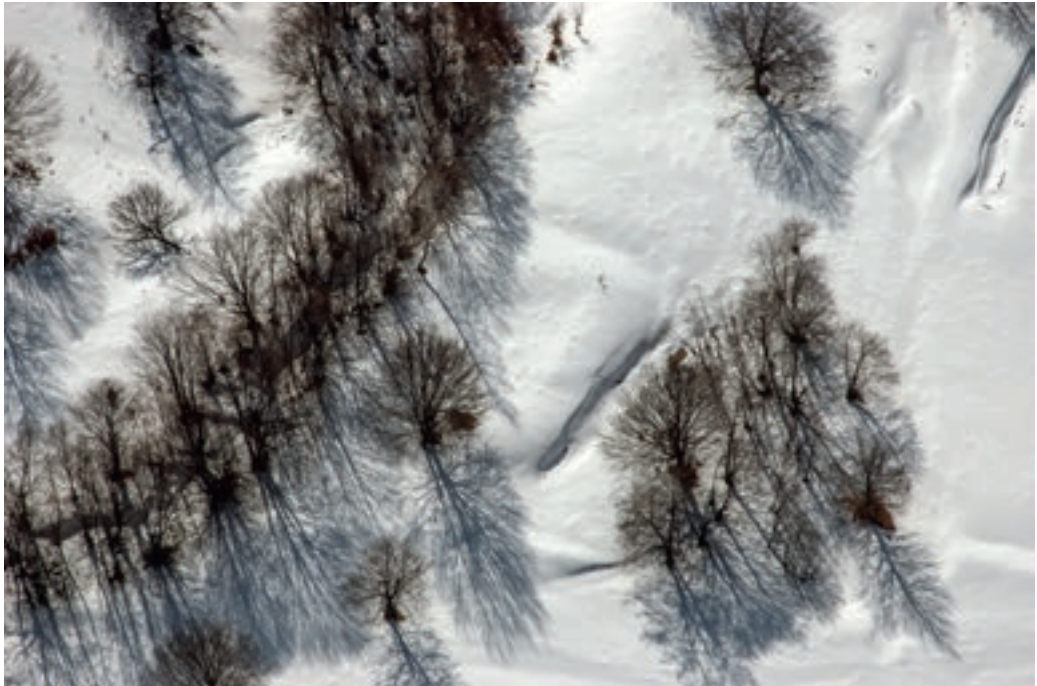
A felsőrépai Kisvárról készült téli légi felvétel