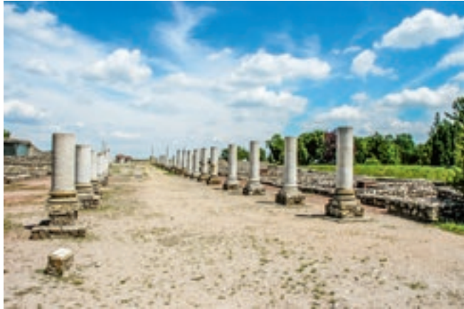
Gorsium Régészeti Park