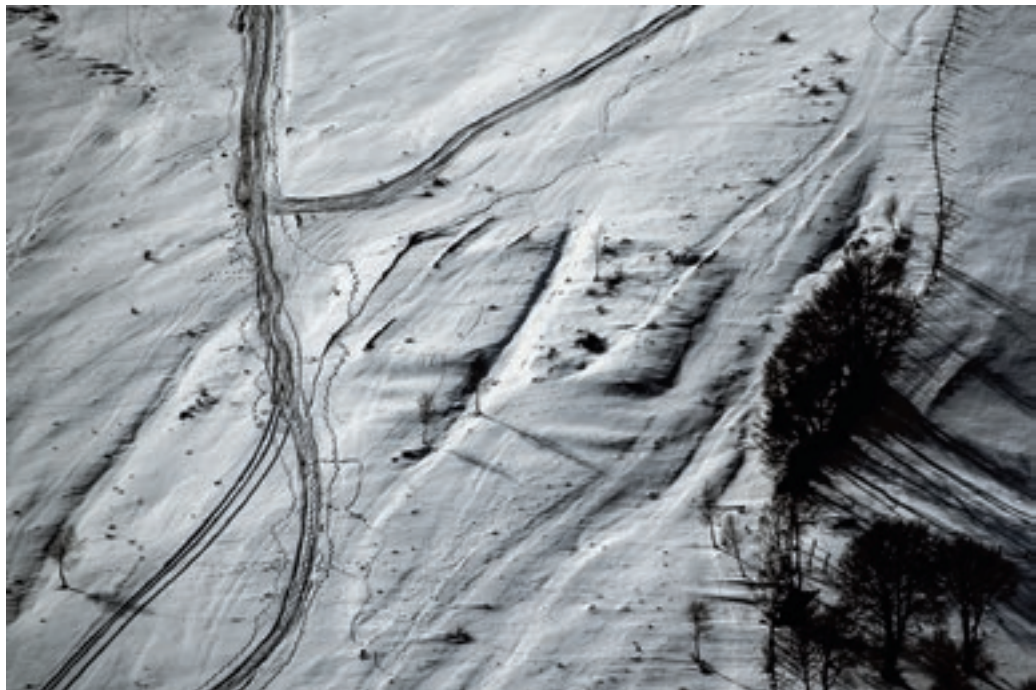
A kerek-bérci kiserődről készült téli légi felvétel