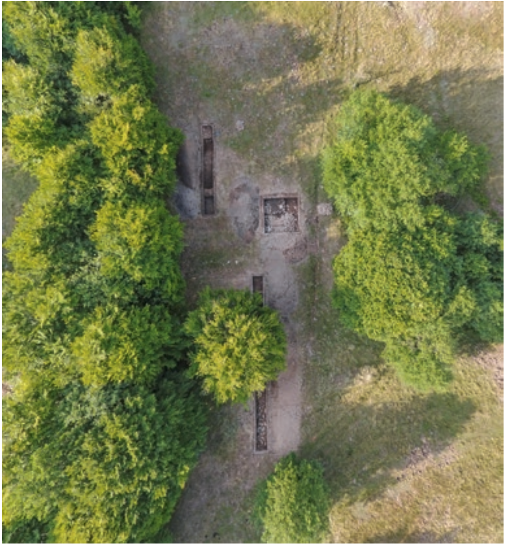
Drón légi felvétel a Kisvár ásatási szelvényeiről (Pánczél Szilamér Péter)