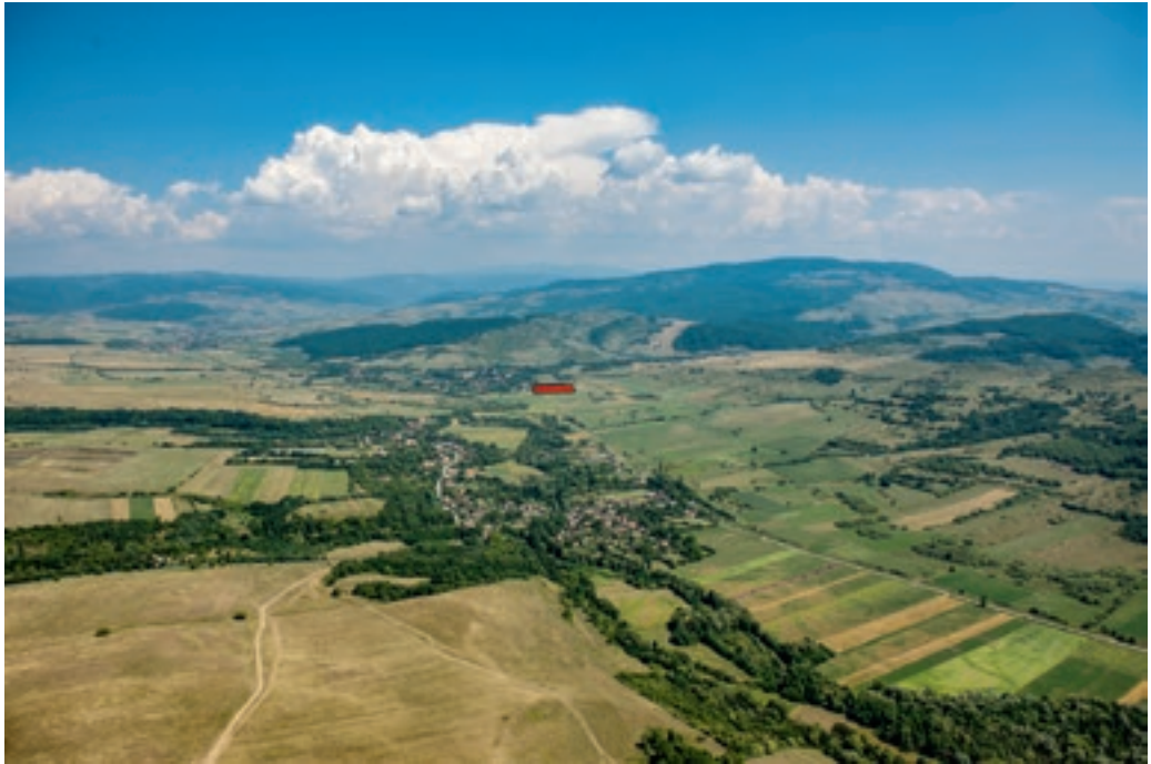
A Nyárád völgyében fekvő mikházi segédcsapattábor és a Keleti-Kárpátok hegyvonulata (Szabó Máté)