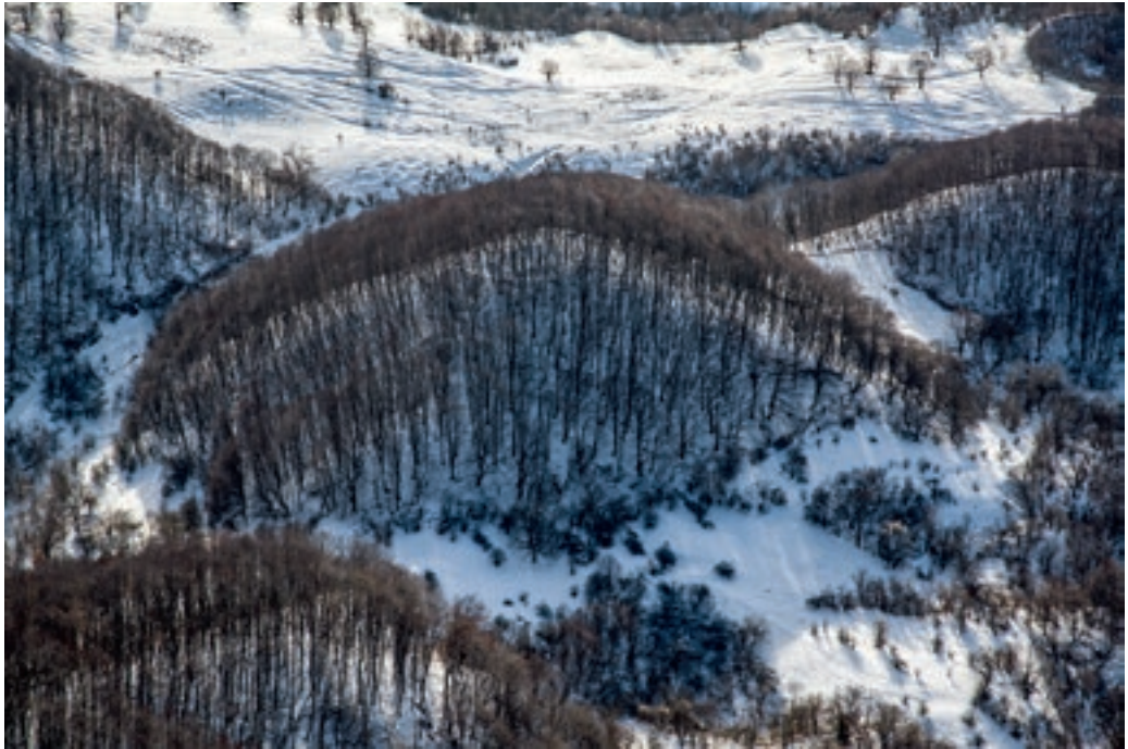
A Mikháza szomszédságban található Vityal középkori vára