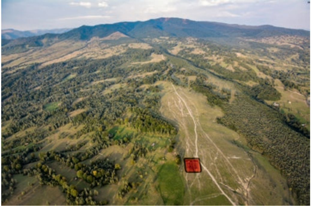
Utakkal szabdalt kiserőd Friss határában