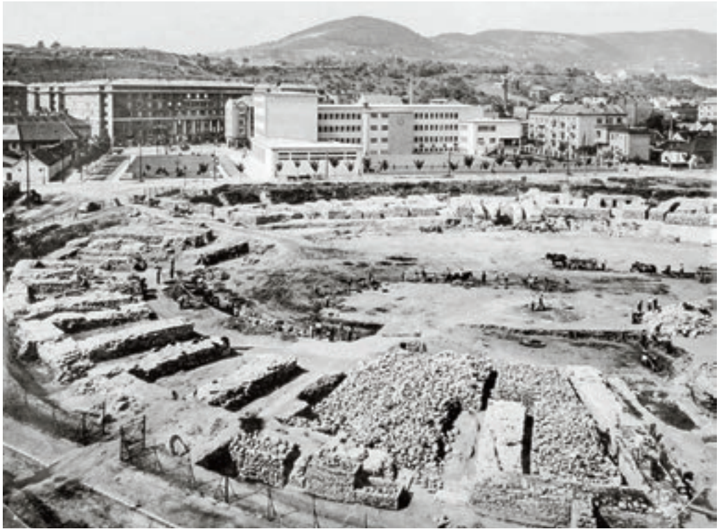
Nagyon jól dokumentált a katonavárosi nagy ásatás