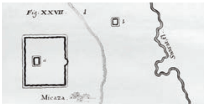
2. ábra A lelőhely alaprajza a 18. század elején (Készítette: Marsilius, A. F.)