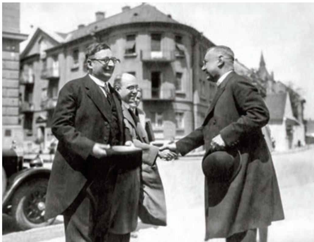
Gróf Klebelsberg Kuno érkezése a debreceni Déri Múzeum megnyitása alkalmából, 1930. május 25.