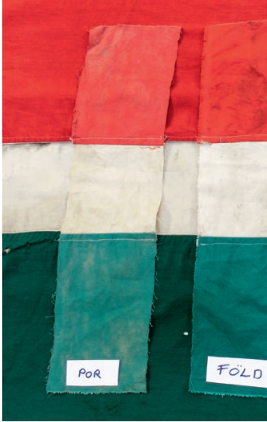
A mintadarabok szennyeződési próbái