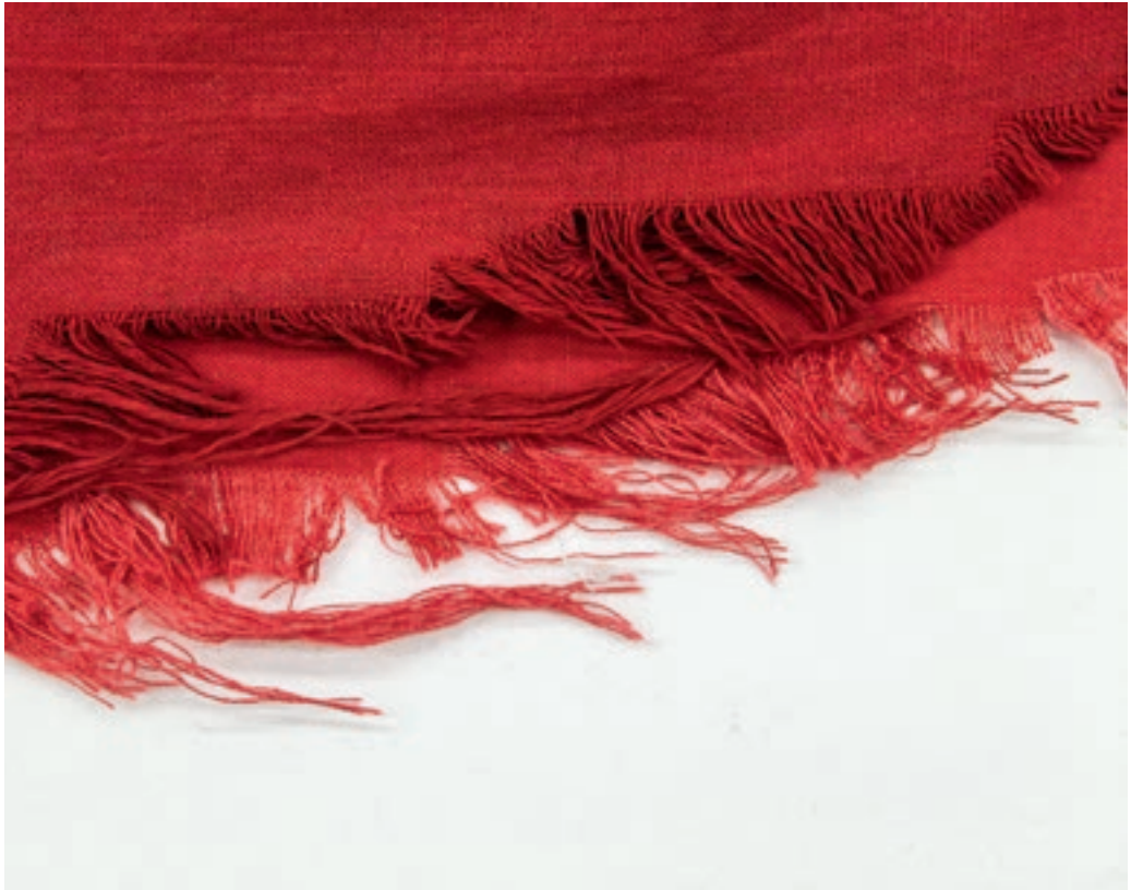
Hosszabb lebegőszál-tömörülés (felül eredeti, alul másolat)