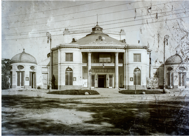
A koložvári Nyári Színház (ma Állami Magyar Színház), 1915