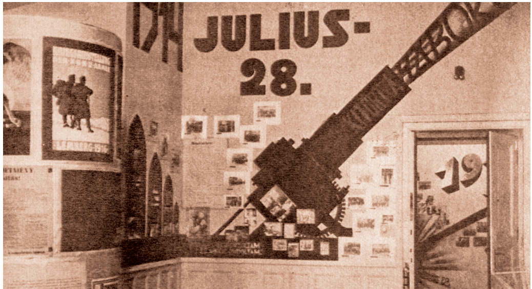
A 20 év politikai története című kiállítás installációi Magyar Nemzeti Levéltár Országos Levéltára