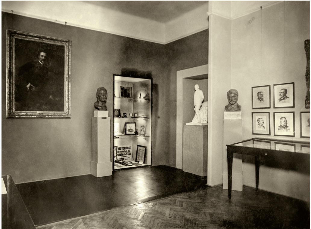
Tisza István korának emlékei