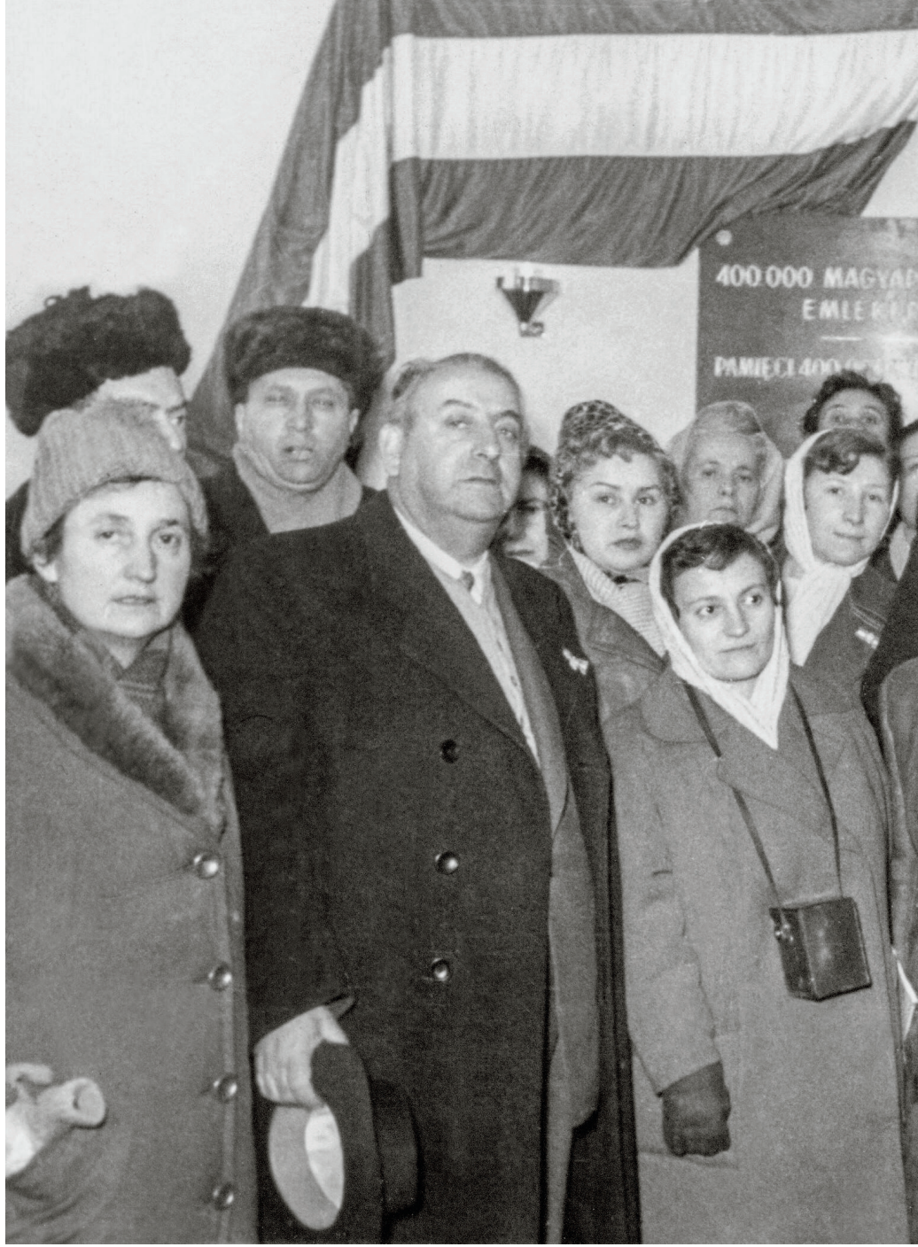
Látogatók az auschwitzi magyar kiállításon, 1959. Székely Károly albumából Forrás: Holokauszt Emlékközpont