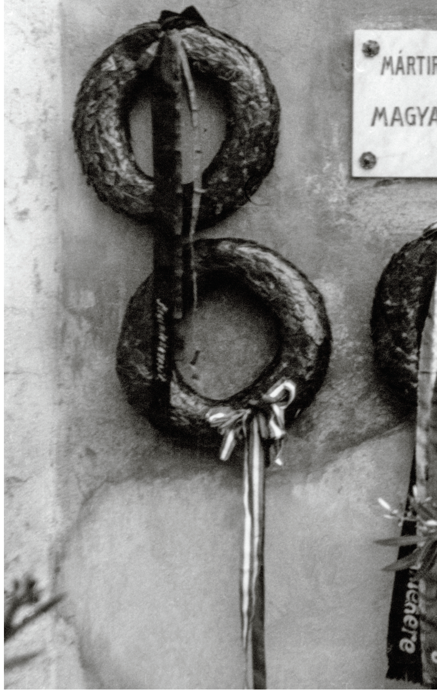
Emléktábla az auschwitzi magyar pavilonban., 959. Székely Károly albumából Forrás: Holokauszt Emlékközpont