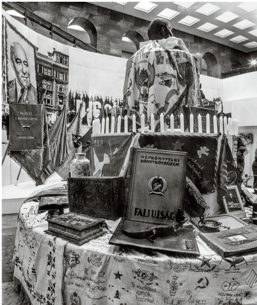
Az 1990-es Sztá-lin! Rá-ko-si! kiállítás a Legújabbkori Történelmi Múzeumban