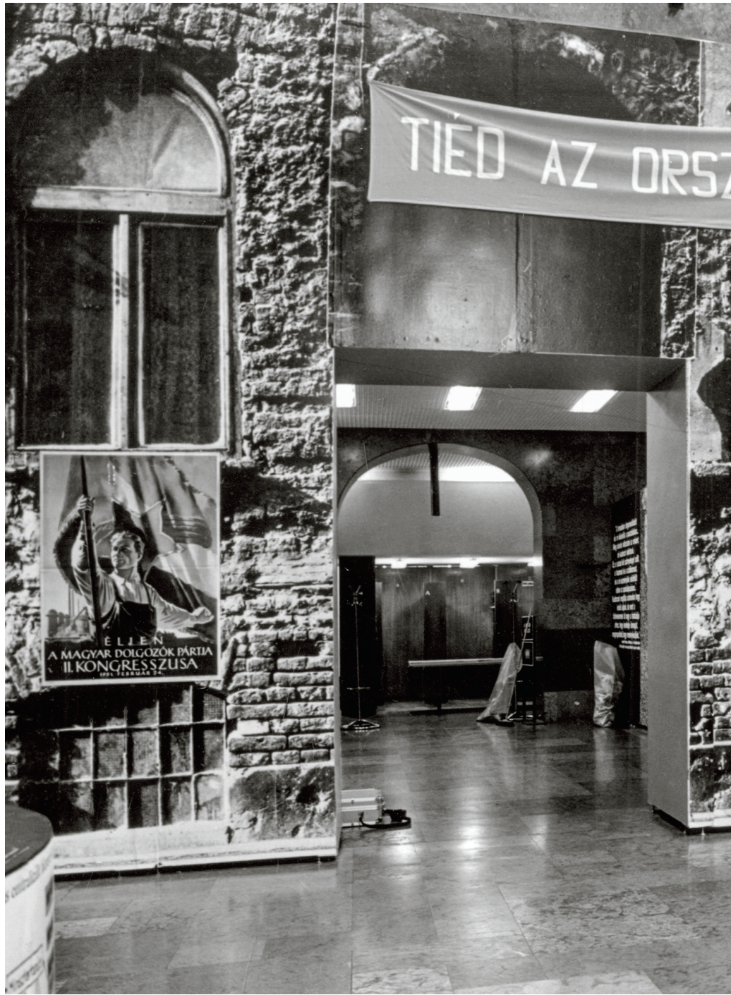
Az 1990-es Sztd-íni Rd-ko-sí kiállítás a Legújabbkori Történelmi Múzeumban