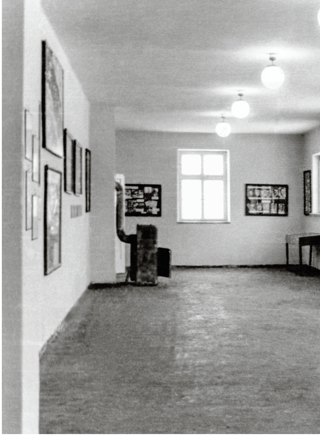
Az auschwitzi magyar kiállítás 1959/60 Székely Károly albumából Forrás: Holokauszt Emlékközpont