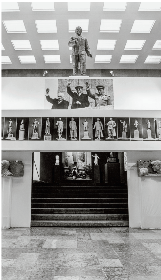
Az 1990-es Sztá- lin! Rá- ko-si! kiállítás a Legújabbkori Történelmi Múzeumban