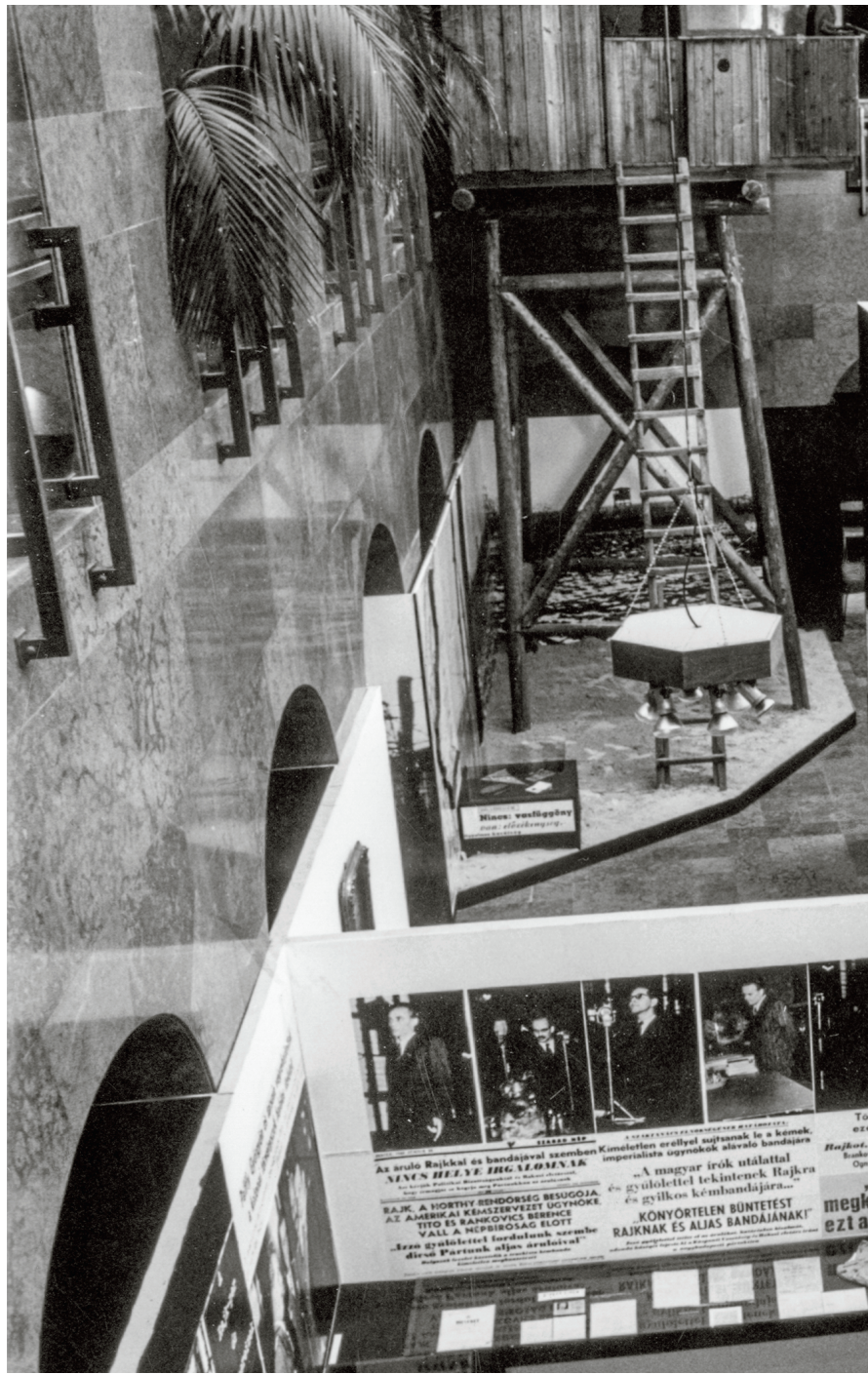
Készült az 1990-es Sztá-lini /Rád-ko-si/ kiállítás a Legújabbkori Történelmi Múzeumban