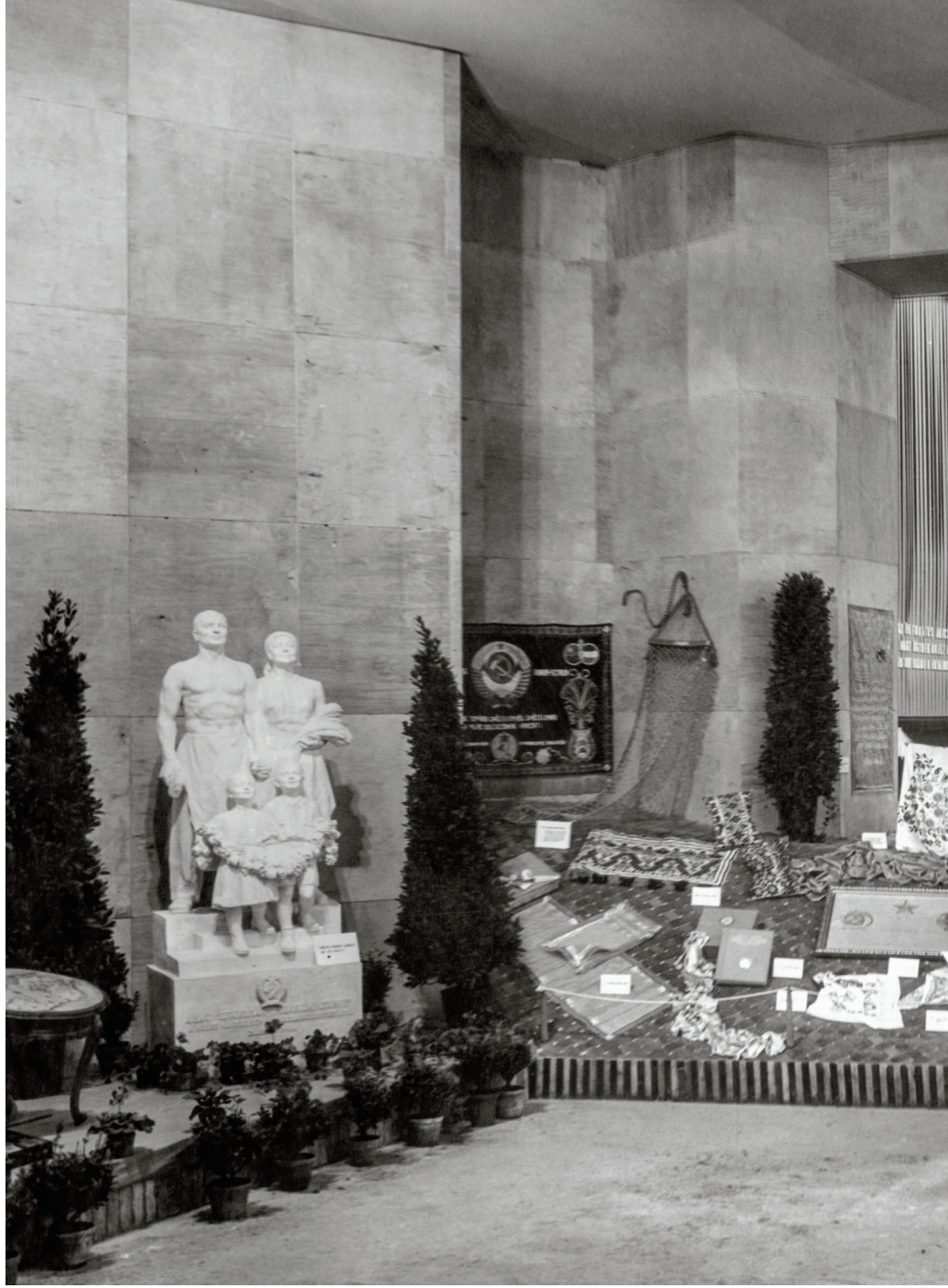
A magyar nép ajándékaiból rendezett kiállítás a Múcsarnokban Sztálin 70. születésnapjára, 1949. december