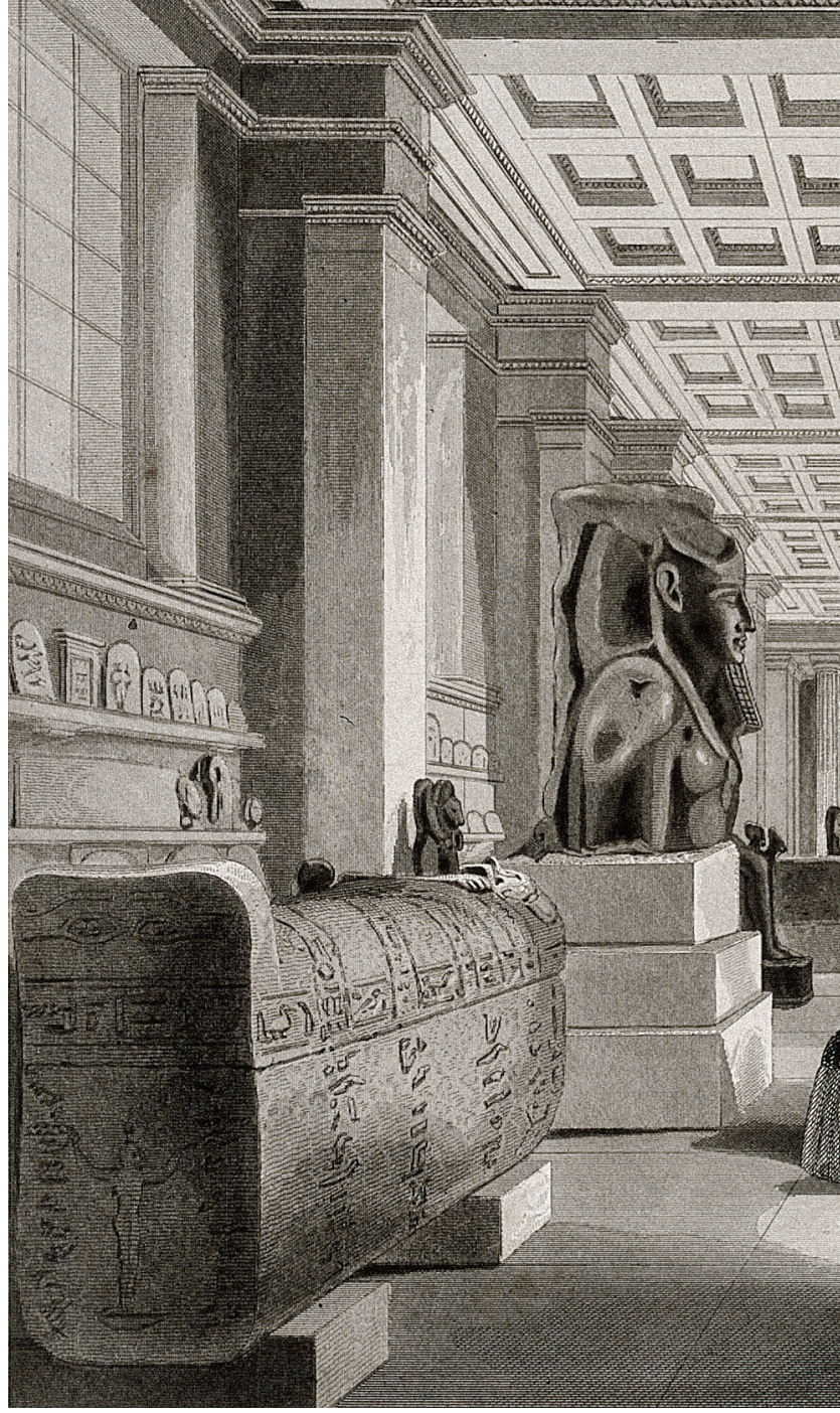
A British Museum egyiptomi csarnoka, illusztráció Forrás: Joseph Mead: London Interiors: A grand national exhibition. II. London, 1841-44