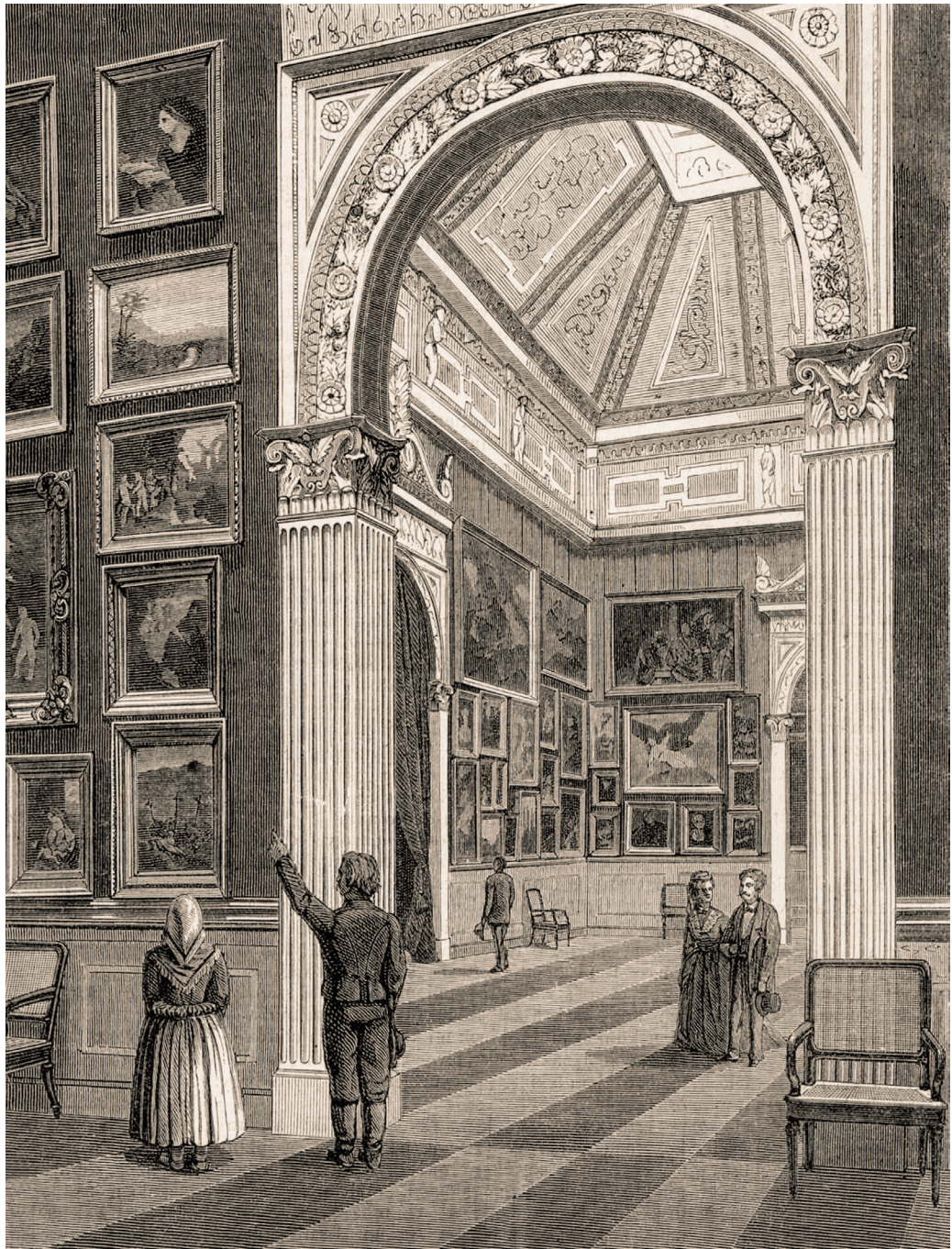
Az Országos Képtár a Magyar Tudományos Akadémia harmadik emeletén, 1874