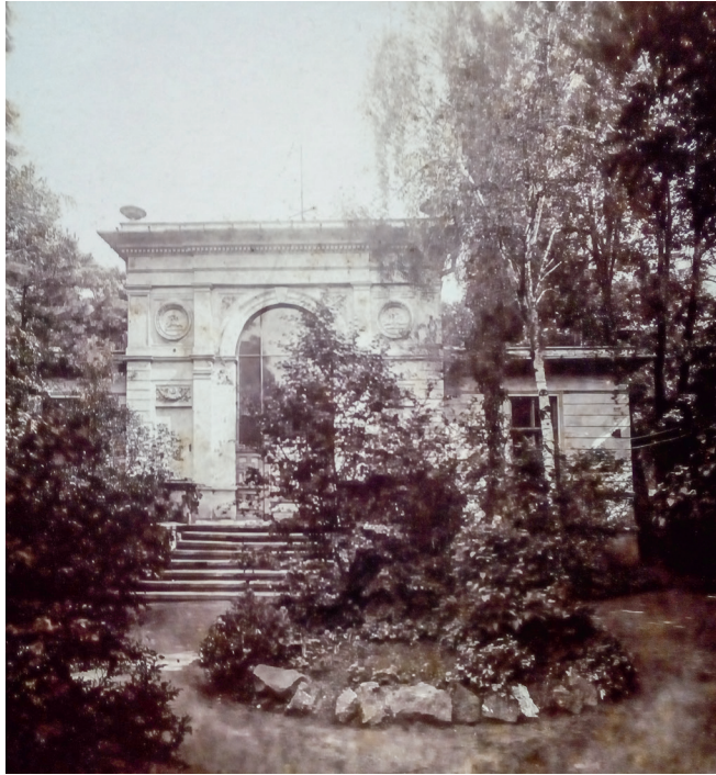
Madarász Viktor műteremháza a Városligeti fasorban