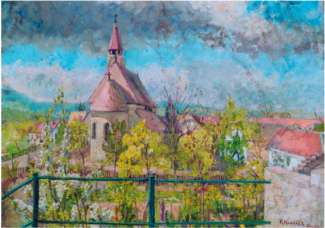
Madarász Adeline: Zebegény, 1940-es évek