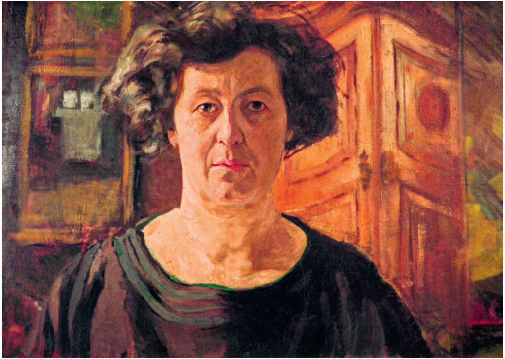
Madarász Adeline önarcképe