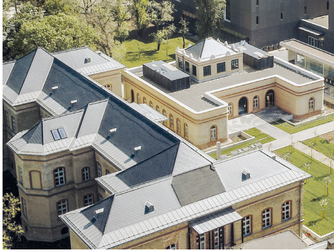
Az egykori izraelita kórház megmentett épületei a Szabolcs utcában