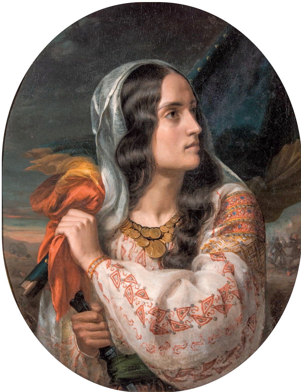
Constantin Daniel Rosenthal: A forradalmi Románia (Maria Rosetti arcképe) Forrás: Muzeul Național de Artă al României, Bukarest